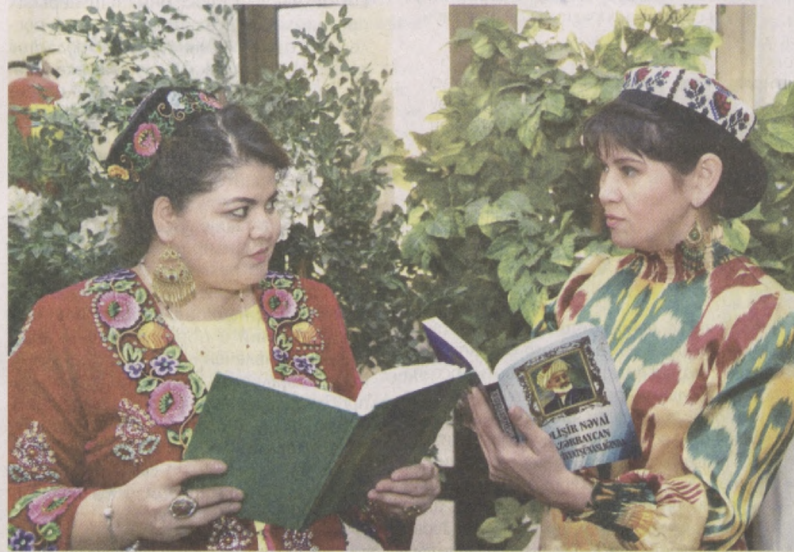
Уже несколько веков имя Алишера Навои светится, как самая яркая звезда, на небосклоне поэзии. Это связано с тем, что в произведениях великого предка воспеты такие высокие чувства человека, как любовь к Родине, гуманизм, просветительство, доброта.

Богатое и многогранное творческое наследие Алишера Навои заняло весомое место не только в узбекской, но и мировой литературе. Его бесценные произведения, такие как "Хамса", "Тарихи мулуки Ажам", "Холоти Сайид Хасан Ардашер", "Рисолаи муаммо", "Мажолис-ун-нафоис", "Муншаот", "Мезон-улавзон", "Холоти Пахлавон Махмуд", "Насоми ул-мухаббат", "Девони Фоний", "Тарихи анбиё ва хукамо", являющиеся духовным богатством нашего народа.