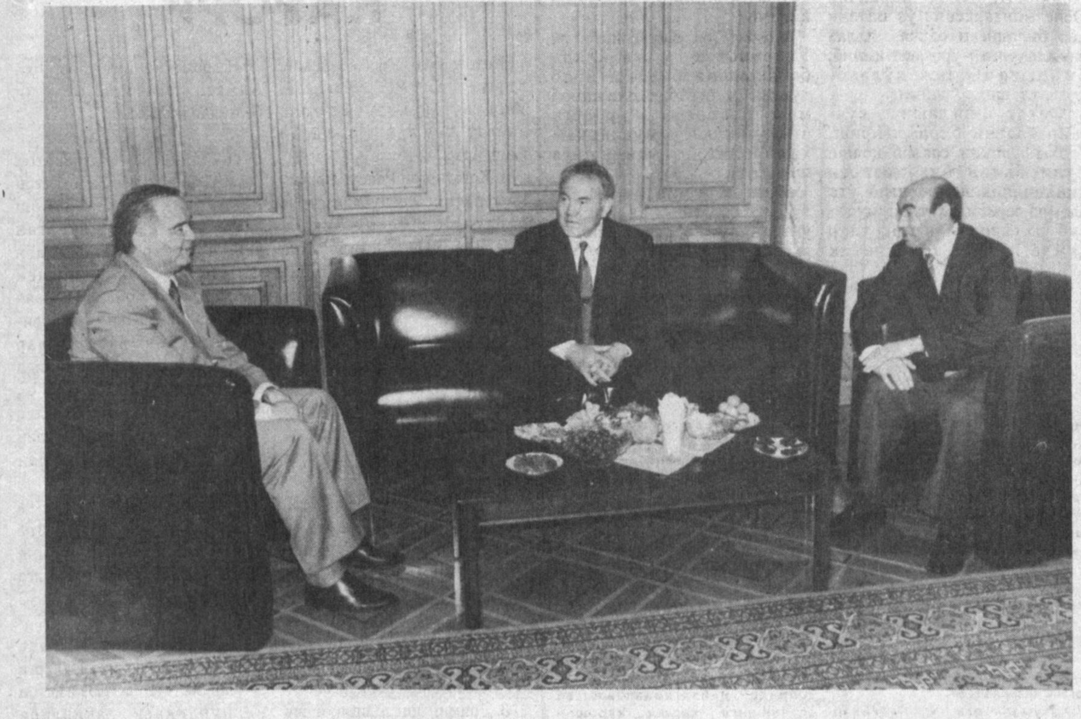
Суратда уч давлат раҳбарларининг саманжий сўҳбати.

Бу кўна дунё кўл тарихий воқеаларнинг шохиди бўлган. Тараққиёт мароми жадаллашган умбу даврда ҳам биз, тарих зарбасига эришмаган воқеа-ҳодисаларга тез-тез гувоҳ бўлмоқдамиз. Бироқ, содир бўлётган воқеалар ичда шундайлар бори, улар бевосита келишимларга, асрларга таттулик, Ўзбекистон, Қозғистон ва Қирғизистон давлат ва ҳукумат раҳбарлари Алматида учрашган 8 июль ана шундай тарихий куллар сирасига кирилади. Учрашув чоғида қадим Туркистон заминидан қардош мамлакатлар муаммолари баҳамхисаб қилдирилди, ҳамкорлик йўлида роят муҳим амалий қадам қўйилди. Уч мамлакат Президентлари ва Бош вазирлари иштирокидаги давлатларaro кенгашининг тузилishi, унинг ишчи органи сифатида доимий фаолият кўрсатадиган ижроия қўмитаси барпо қилиниши, итисодий интеграцияга қўмаклашувчи давлатларaro Марказий Осие ҳамкорлик ва ривожланиш банки таъсис этилишига ахдлашув шубу тарихий учрашувнинг