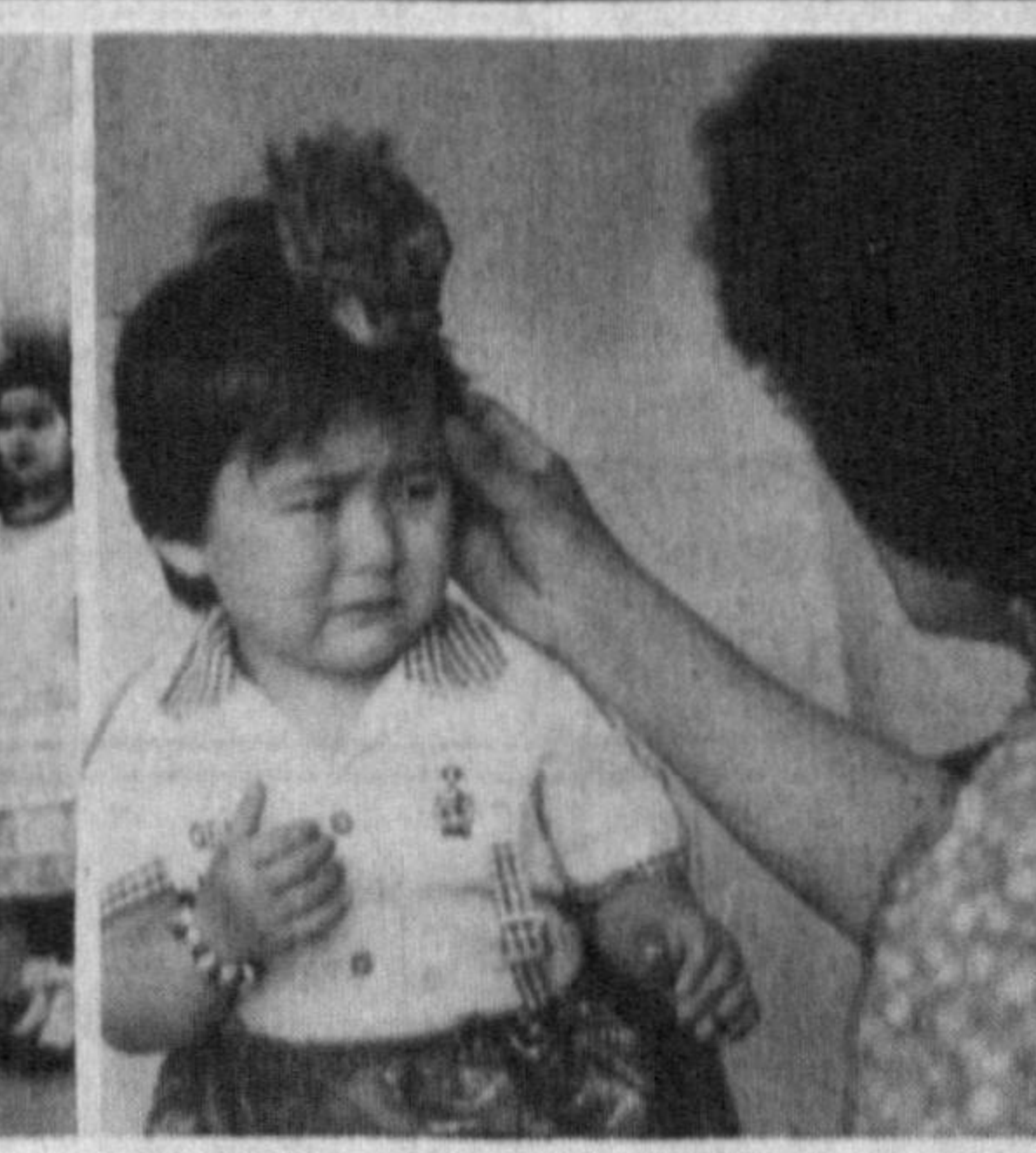
Болалар ҳаётининг кўриниши. Биронта байрам, биронта оилавий тадбир болаларимизнинг шодон кунгуларини ўташга, сабаби болалар юзиданги табассум ҳаётининг мезонидир. Сиз кўриб турган суратлардаги болаларимиз чехраларга бир боқинг. Байрамга янги кўйлак кийган қизларча ҳам, йилмадандир ранинган гўдак ҳам, машинада худди ҳайдовчилардек ўтирган болалар ҳам бизнинг кечаги кўнаниш, эртани келажакимиздир.