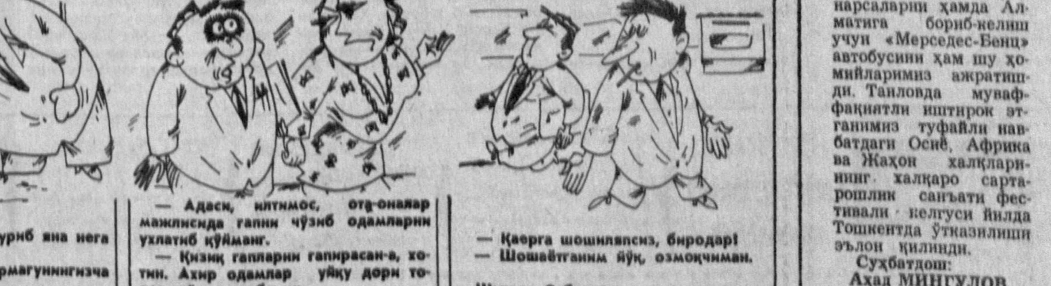
— Адаси, китмоси, отг-онлар...