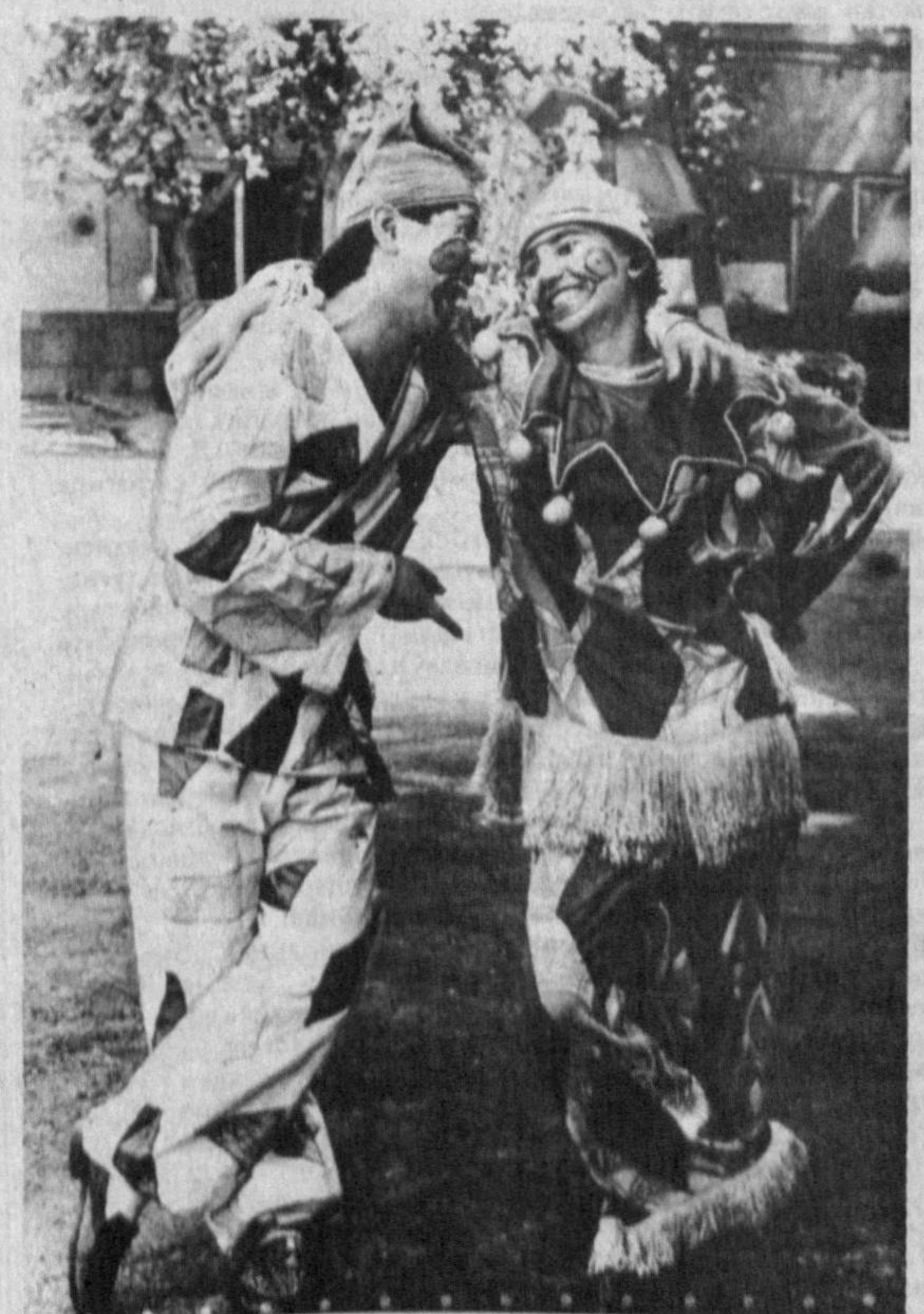
Кейин тўй-томаш қизиқчиси ўтган...