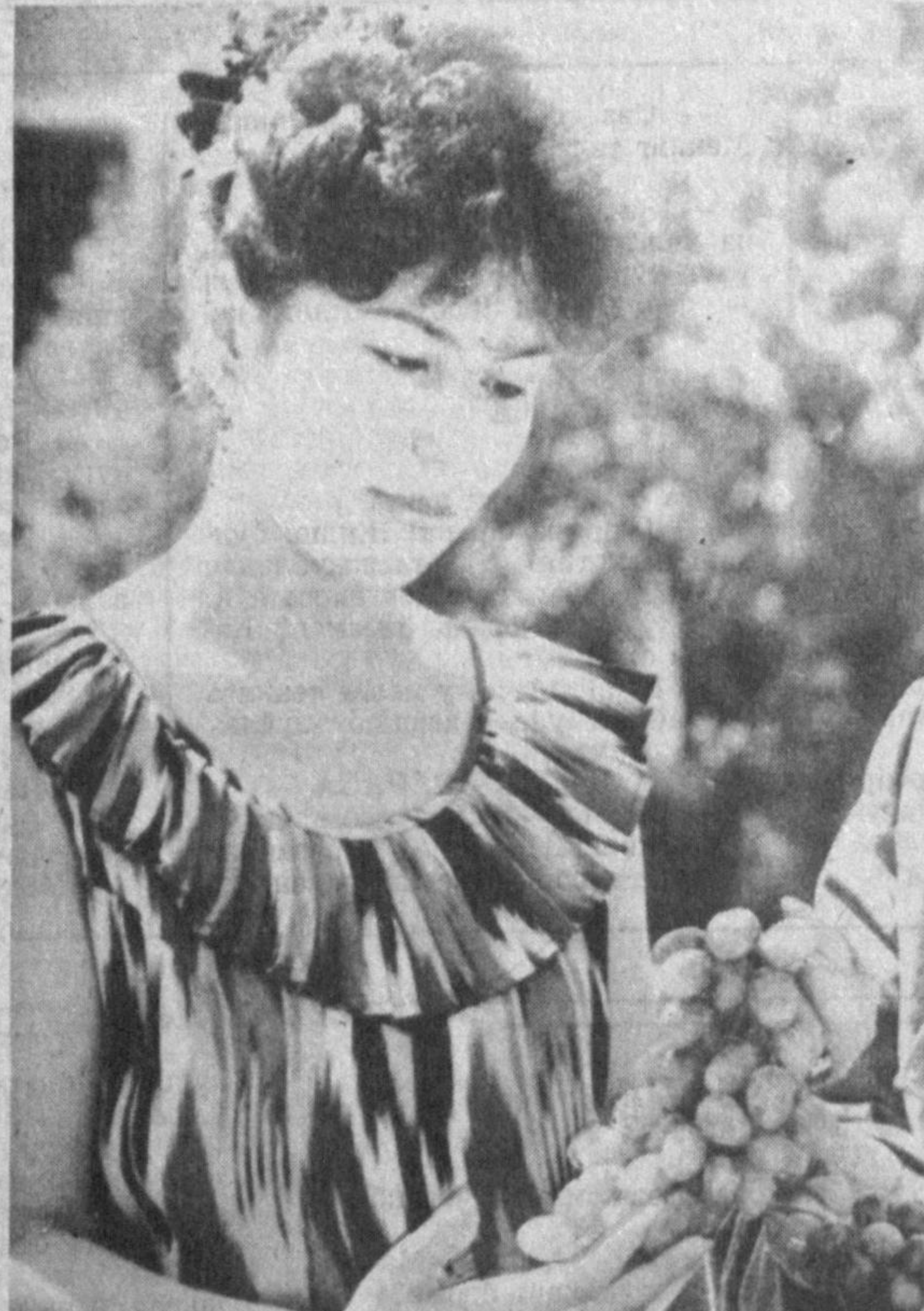
Ҳозир ўлкамизда узум айни пиллиб етилган палла. Шу боис шаҳримиздаги қайси бир бозорга борманг, турли хилдаги ширин-шакар, қаҳрабоз узумлар савдо қилинганнинг гувоҳи бўласиз...