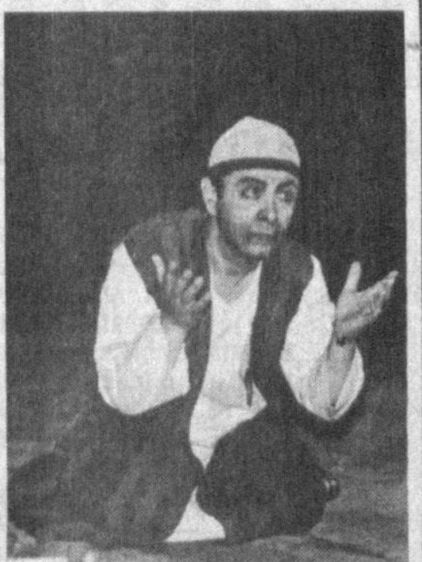
Шаҳримизда шундай маскан борки, унинг ёнидан ўтган кишининг ноҳадон беғубор болалик чоғлари кўза ўнгидан намойиш бўлади. Ўшуборин йўлдош республика болалик таърифи ташриф қилган одам камдан-кам учраса керак.

бўлганда айрим ота-оналар ўз қизларини тарбияга чарқираман, деб хато қилиб қўйишади. Ваҳоланки, ҳар қандай фарзанд ҳам онадан ноқобил бўлиб туғилмаслиги, бунда ота-онанинг тарбияси, қолаверса, фарзандга ўз-