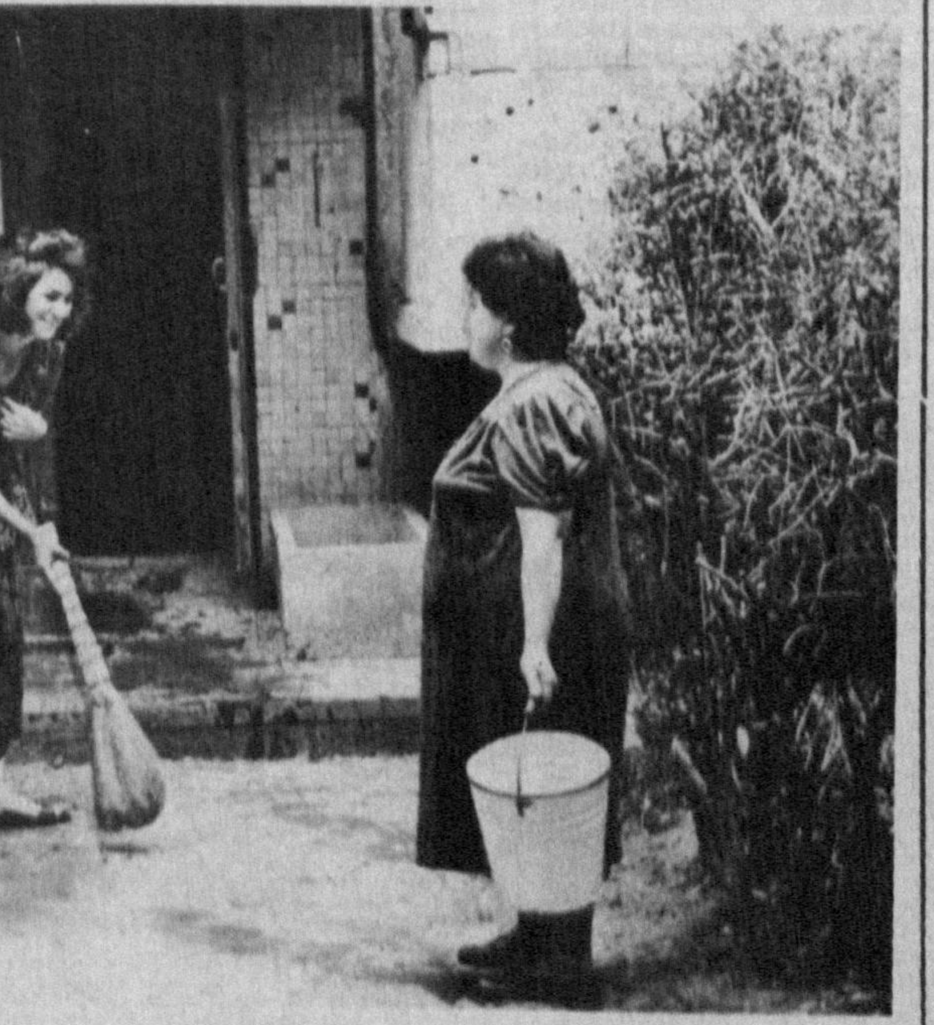
Азалдан қадрлини келатган ажойиб удуларимиздан кўт-барака, фаяз армайдан. Айниқса тонг саҳарлаб уларнинг олдида ўсгангиз, келинчалару қизларнинг атрофини супуриб-сидириб тозалашганини кўриб, кўзингиз қувнади, динингиз ярайди. Меҳнатқаш, озода, уй юмушларини тўла.