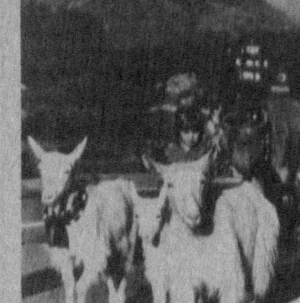
Шевцария. Аял тоғларининг ўйинли ўт-ўстига тўла айбонлар ҳақида кўп ва кўп ёзилган. Шунинг учун ҳам айбонларни доҳон-фермерлар 82 келиши билан омма-ёъзовари билан биргаликда ўз подварини эна шу айбонлар-га қайта келтириш.