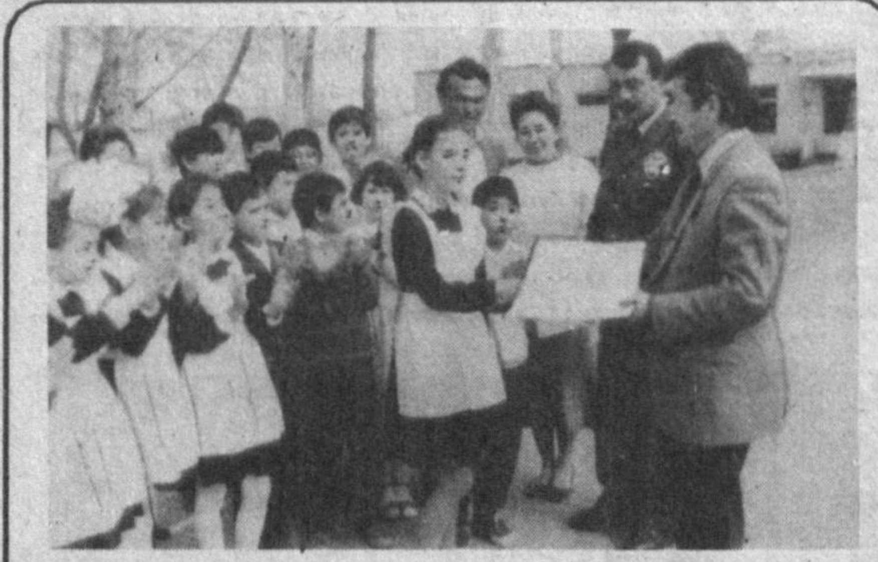
Бектемир туманида болаларга йўл ҳаракати қоидаларини ўргатиш ишлари яхши йўлга қўйилган. Бу эса йўл-транспорт ҳодисаларининг олдини олишда муҳим роль ўйнайди. Жамоатчи муҳбиримиз Усмо Усмонов олган суратларда тумандаги "Йўлчирик-94" мусобақаларида болалар ўз билим ва кўникмаларини кўрсатётган лаҳзалар муҳланган.