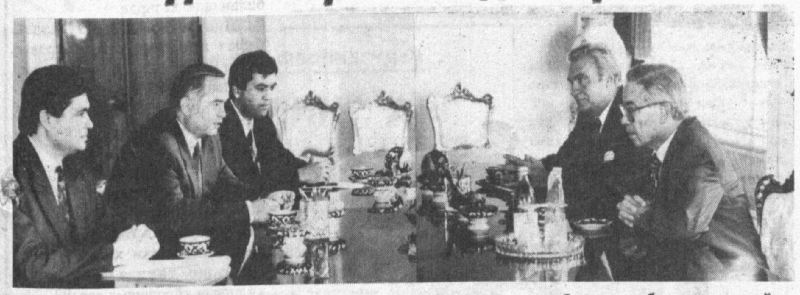
СУРАТДА: БМТнинг Афғонистондаги махсус миссияси раҳбарини қабул қилиш пайти.

Ўзбекистон Республикаси Президентини Исом Каримов 1 август кунини мамлакатимизда меҳмон бўлиб турган Туркиянинг «Бейенди» фирмаси бошқаруви раиси Меҳмет Бейендини қабул қилди. Дўстона мулоқот чоғида Ўзбекистон ва Туркия ўртасидаги савдо-иқтисодий муносабатларни ривожлантириш истиқболига дахлдор масалалар муҳокама этилди. Туркиялик меҳмон самимий қабул учун мамлакатимиз раҳбарига миннатдорчилик изҳор этди. * * * Ўзбекистон Республикаси Президентини Исом Каримов 2 август кунини БМТнинг Афғонистондаги махсус миссияси раҳбари, БМТ Бош қотибнинг махсус вакили Махмуд Мистирини ҳамда БМТнинг Афғонистонга инсонпарварлик ердани кўрсатиши мувофиқлаштирувчи бюроси директори Миссурис Сотирисни уларнинг илтимосига биноан қабул қилди. Суҳбат чоғида Бирлашган Миллатлар Ташкилотининг