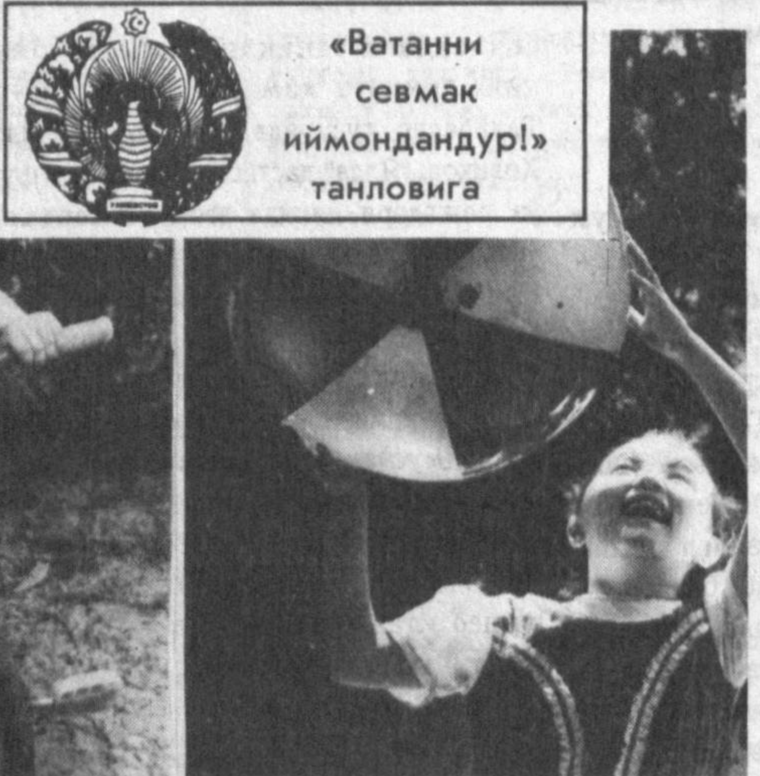
«Ватани севмак иймондандур!» танловига

Болалик! Унинг ширинлигини, шўхлигини таъриф этмаган шовир бормикин? Ҳар бир инсон болаларда — невараларда, эвараларда ўзининг ўйинқор болаллигини кўраётган бўлади. Болалар нузли кўнгил остида озод Ватанимиз бағрида дорилмон хуррам яшамокдалар. Болалар