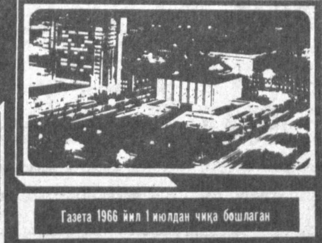
Газета 1966 йил 1 июдан чиқа бошлаган

Вир йилга - 264 сўм. Олти ойга - 132 сўм. Уч ойга - 66 сўм. «Тошкент оқшом»нинг индекси - 64680. ОБУНА БУЛИШГА ШОШИЛИНГ!