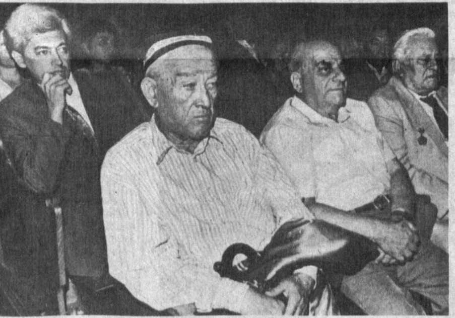
Мардлар қуриқлайди Ватанни