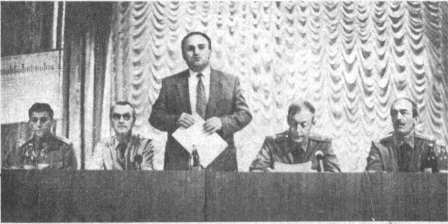
Армияга кузги чақирик олдидан