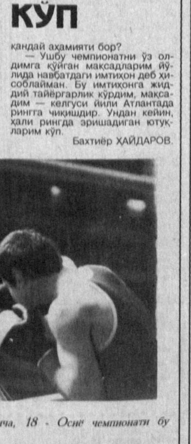
Ўзбекистонда бокс спортни аввали ва унга хос анъаналарга эга. Мутахассисларнинг фикрича, 18 - Осиё чемпионати бу анъаналарни яна бир поғона юқорига кўтарди.