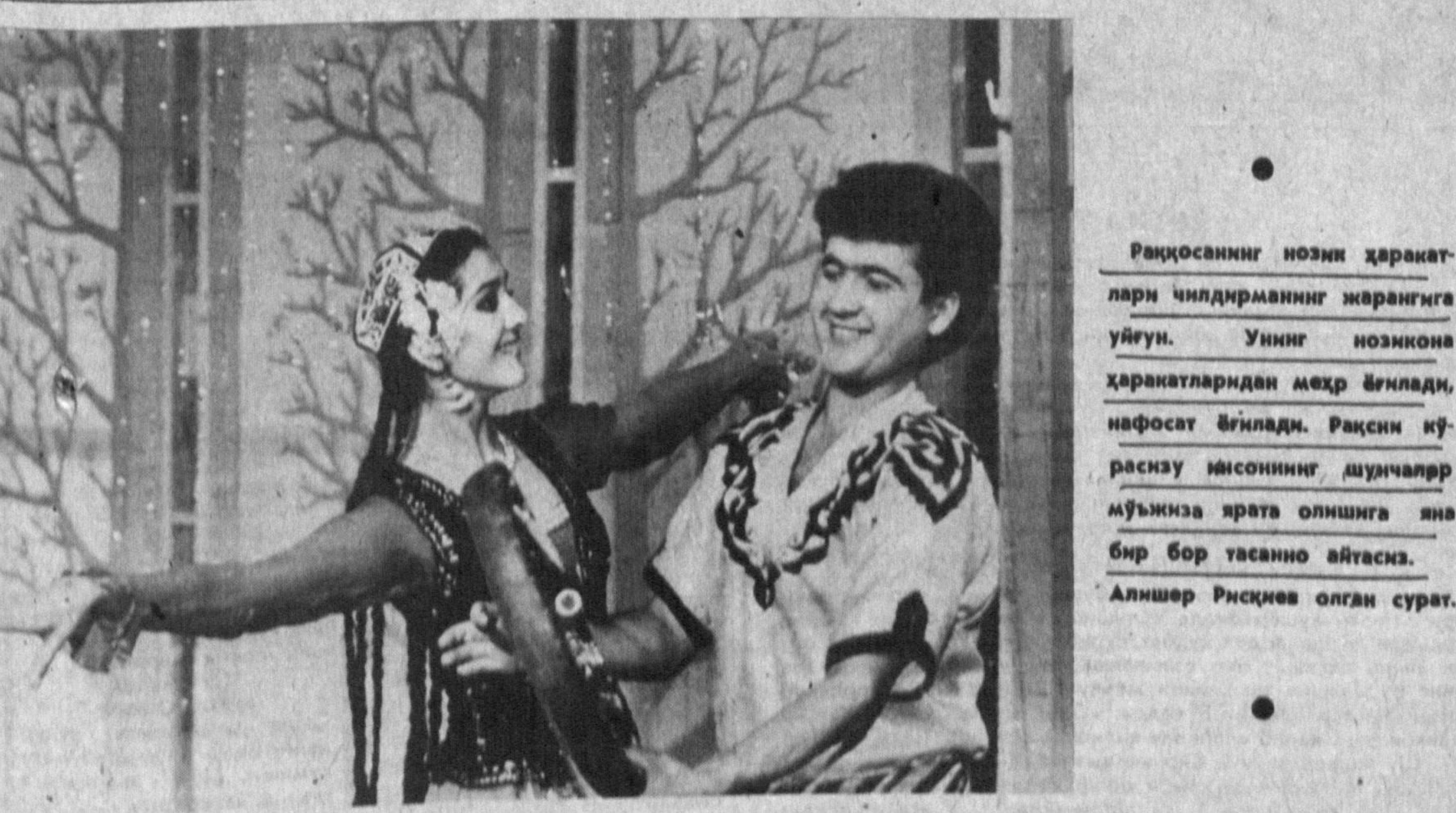
Рақосанинг нозин ҳаракатларини чилдирманнинг жарангига уяғун. Унинг нозикона ҳаракатларидан меҳр ёнлайди, нафаси ёнлайди. Рақсини кўрсатуш ишонининг дунчалар мўйизига ярат олинига яна бир бор тасанно айтасиз.