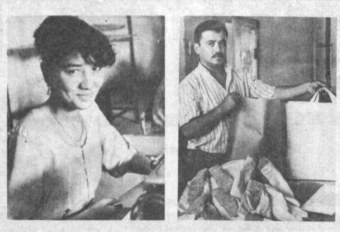
Қоплардан қайта ямаб тайёрлаб бериш юкланса, қилиб бера оламизми? — Албатта, асосий вазифамизнинг ўзи шундан иборатки. Ваҳоланки, айни вақтда 500 минг донга қайта таъмирланган, 500 минг донга Қирғизистон Республикасидан келтирилган янги қоплар тайёр турибди. Бу қоплар тўлиқ ишлатилгунча, биз яна бошқа буюртмаларни бажаришимиз мумкин.

ҳам алоҳида эътибор берила бошланди. Бизнинг зиммамизга ун ва дон маҳсулотлари учун қолларни ямаб фойдаланишга ярайдиган қилиб бериш вазифаси топширилган. Мана шу йўлда ҳормай-толмай меҳнат қилаверамиз. Энди фирма бўлиб иш бошлаганимиз ҳақида гапирадиган бўлсам тан олиш кераки, ишчилар тушунчасида катта ўзгариш бўлди. Ишга бўлган масъулият, дастгоҳларга бўлган муносабат, ҳатто корхонамизга келадиган буюртмачиларнинг ҳам таширифи мутлақо ижобий