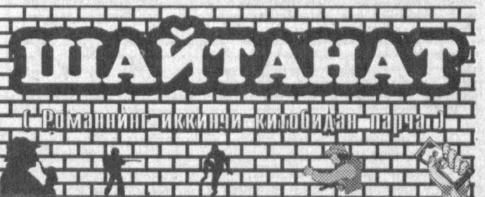
(Давоми. Боши газетанинг 111, 113-сонларида.)