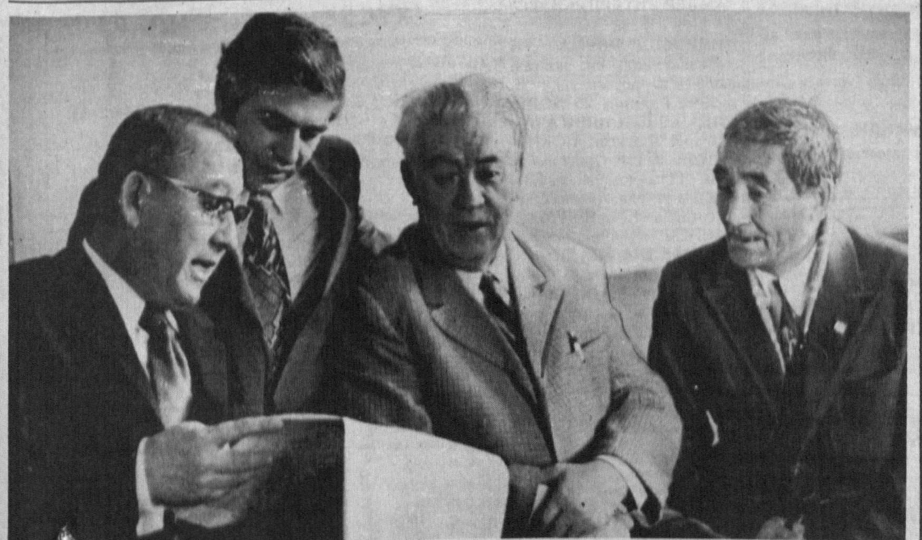
Таҳририятимиз бисотида сақланаётган ушбу суратда (chapдан-ўнгга) Ўзбекистон халқ ёзувчиси Раҳмат Файзий, Нормурод Нарзулаев, Ўзбекистон халқ шоирлари Уйғун, Қудуус Муҳаммадийлар

— Ҳозирги пайтда дубляж ҳақида гапирадиган бўлсак, бизнинг ижодий гуруҳимиз Ўзбекистонда ягона дубляж гуруҳидир. Жамоамиз ўз фаолиятини 1936 йили "Бой келин" деган фильмни ўзбек тилига ўгириш билан бошлаган. Фильмга режиссер Одил Шароповнинг бевосита иштироки билан қайта овоз берилган. Халқимиз аксарият киноларни ўз она тилида кўришга одатланган. Бошқачароқ айтганидан бўлсак бизнинг дубляж гуруҳимиз давлат тили — ўзбек тилининг тарбибчиси. Фақатгина тилимизни ташвиқот қилиш билан чекланиб қолмасдан, ўзбек томошбинларини дунё халқлари турмуш тарзи, маданияти, урф-одатлари билан улзуксиз таништириб боради.