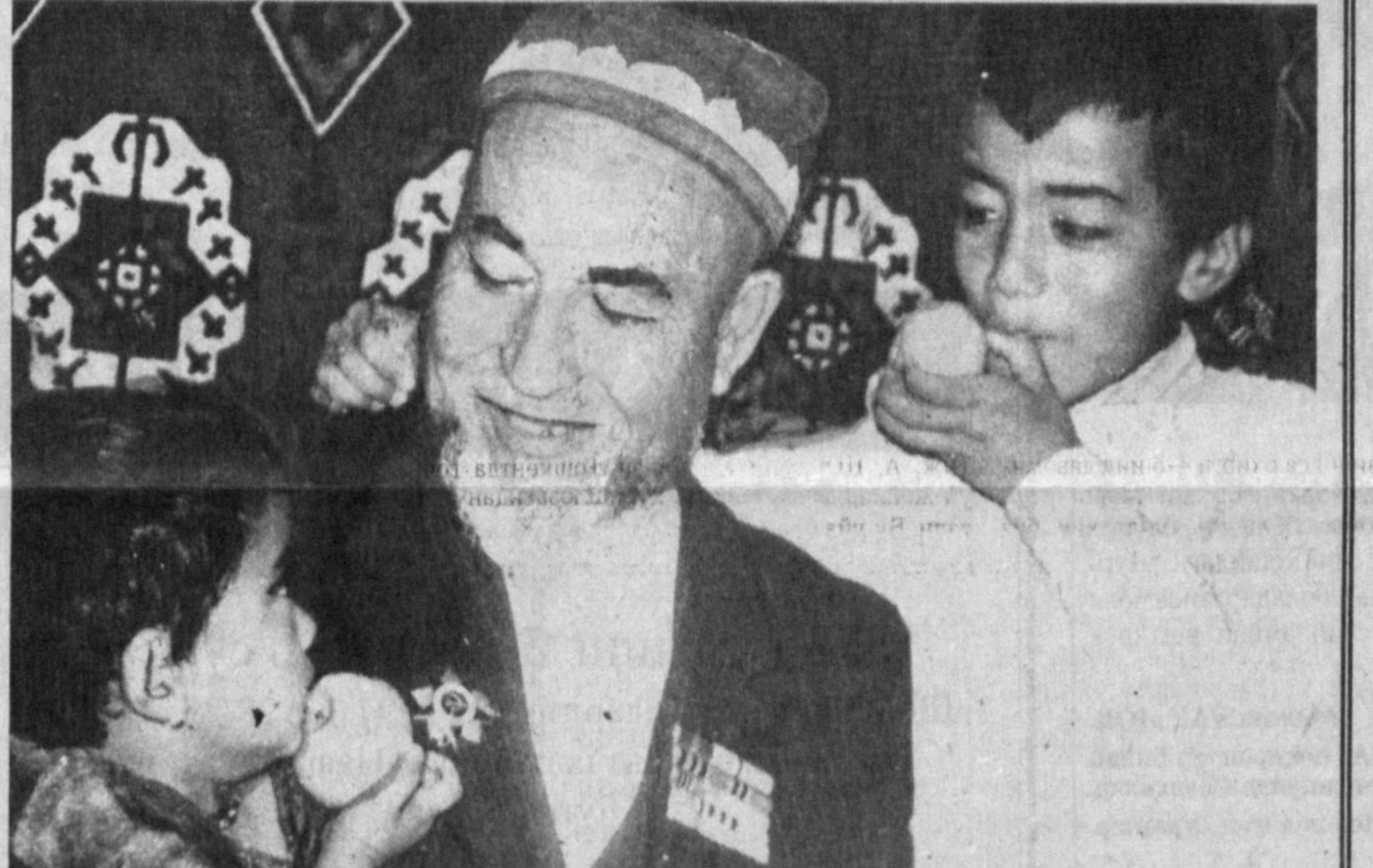
Бобосининг келтирган совгалари набираларнинг қувончига қувонч қўшмоғи шубҳасиздир. Шунинг учун уларнинг кўзлари боболарнинг йўлида бўлади.

Ўғлим, менинг қачон қайтишим номаълум бўлиб турибди. Балки бутун, эрта қайтмасман. Меҳмонларга яхши қараб тур. Урларидан туршилар билан жойларни йиғиштириб, юз-қўлларни ювгани сув бер, тоза сочик тутказ, сўнг салом бериб, яхши етиб-турганликларини сўра. Сут-қаймоқ билан нонушта бер. Қарақ бўлса, отларига ем бер. Хуллас, хурматларини жойига қўй. Башарти бутун кетишадиган бўлиб қолишса, мендан дуо айт, келмаслигини сабабини айтиб ўз сўра. Қутгани кетса, кузатиб бор. Қўй илгмайдиغان бўлганда орқалидан қараб тур... Қадимий езма едгорликлар, муборақ ҳадиси шарифларда ҳам меҳмондўстлик, меҳмонни хурмат қилиш хусусида қимматли фикрлар баён қилинган. Меҳмон ўз ризи билан келади, дейди доғишманд халқимиз. Шундай экан қўнглини кенг тутайлик. Ўзимиздан меҳмон қадами уйимизин! Мирза Анвар ҚАРИМОВ.