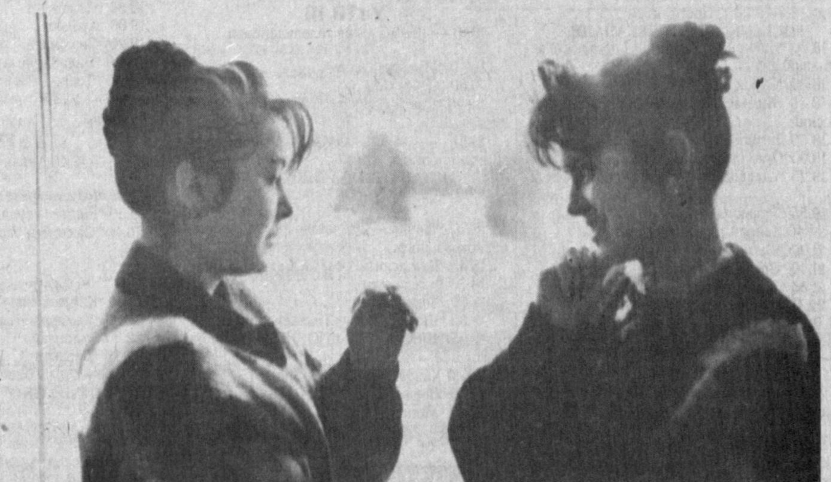
Қизлар сирлашганда.