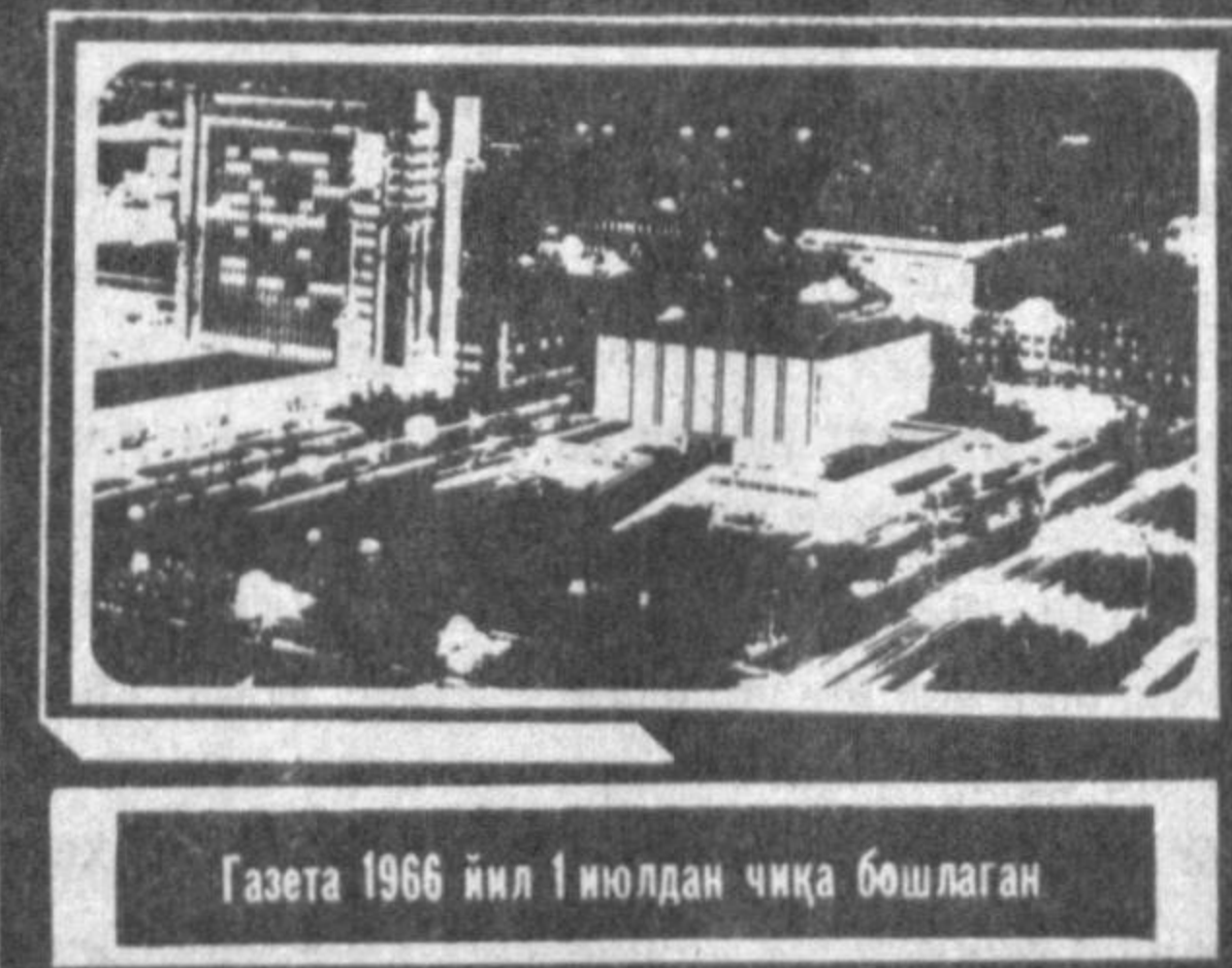
Газета 1966 йил 1 июлдан чўққа бошлаган