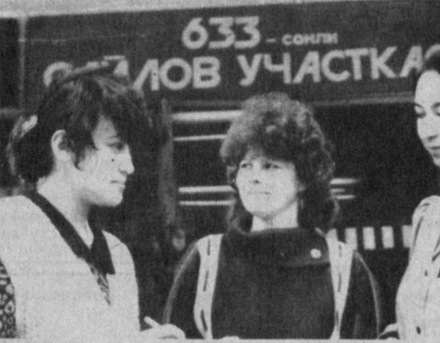
Яккасарой туманидаги 72-мактаб лицейда жойлашган 633-сонли ўзбекистон Республикаси Олий Мажлиси ва маҳаллий кенгашларга ўтказилмаган сайловларга пухта тайёргарлик билан келидилар. Бу ерда сайловда иштирокчи ҳар томонлама намунали ташкил этилди. Индида сайлов участкасига келадиган кишилар халқимизнинг муносиб фарзандлари учун овоз берадилар. Диктантинга ҳавола этилаётган суратларда сайлов участкаси жонқурларининг сўнги тайёргарлик ишларини тасвирга туширилган.