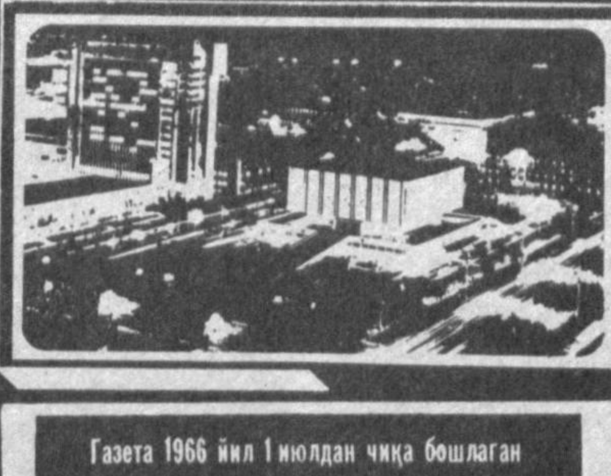
Газета 1966 йил 1 июлдан чиқа бошлаган