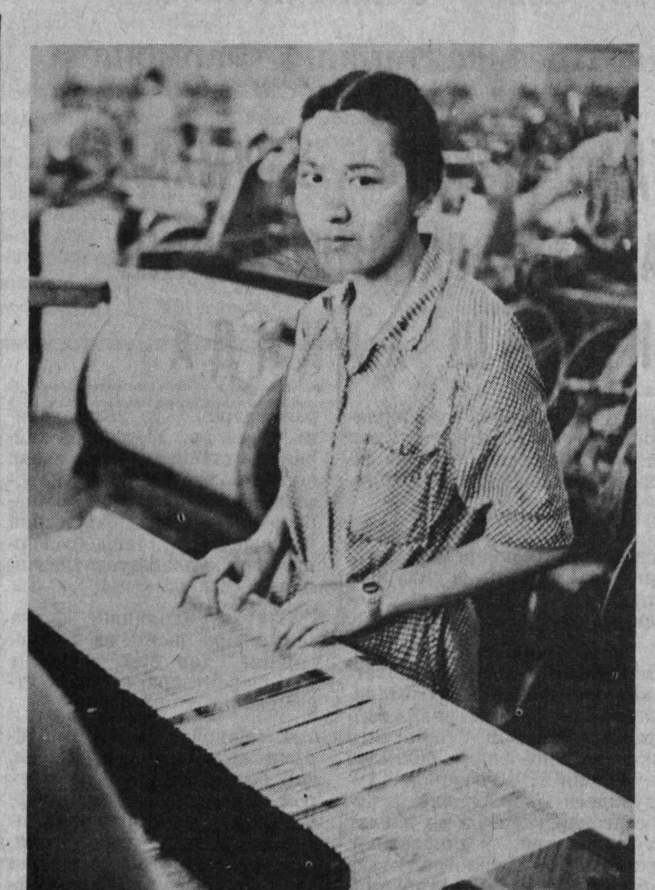
Тошкент ип-газлама ишлаб чиқариш бириликсининг 4-йиғрув фабрикасида қўлаб ёшлар меҳнат қилишади. Улар жамоа меҳнат ютуқларига муносиб ҳисса қўшмоқдалар. Ушбу суратда бўлиб чиқариш бириликсининг 4-йиғрув фабрикасида қўлаб ёшлар меҳнат қилишади. Улар жамоа меҳнат ютуқларига муносиб ҳисса қўшмоқдалар.

Диган фойдани қўпайтириш бундан икки йил муқаддам оғир аҳволда қолган эди. Белгиланган режалар мунтазам бажарилмас, иқтисодий аҳвол ой сайин ёмонлашар, ишчиларнинг маошлари пасайиб кетган, кўпчилик бошиқа корхоналардан иш излашар дурустор жой топанлар ўтиб кетишарди.