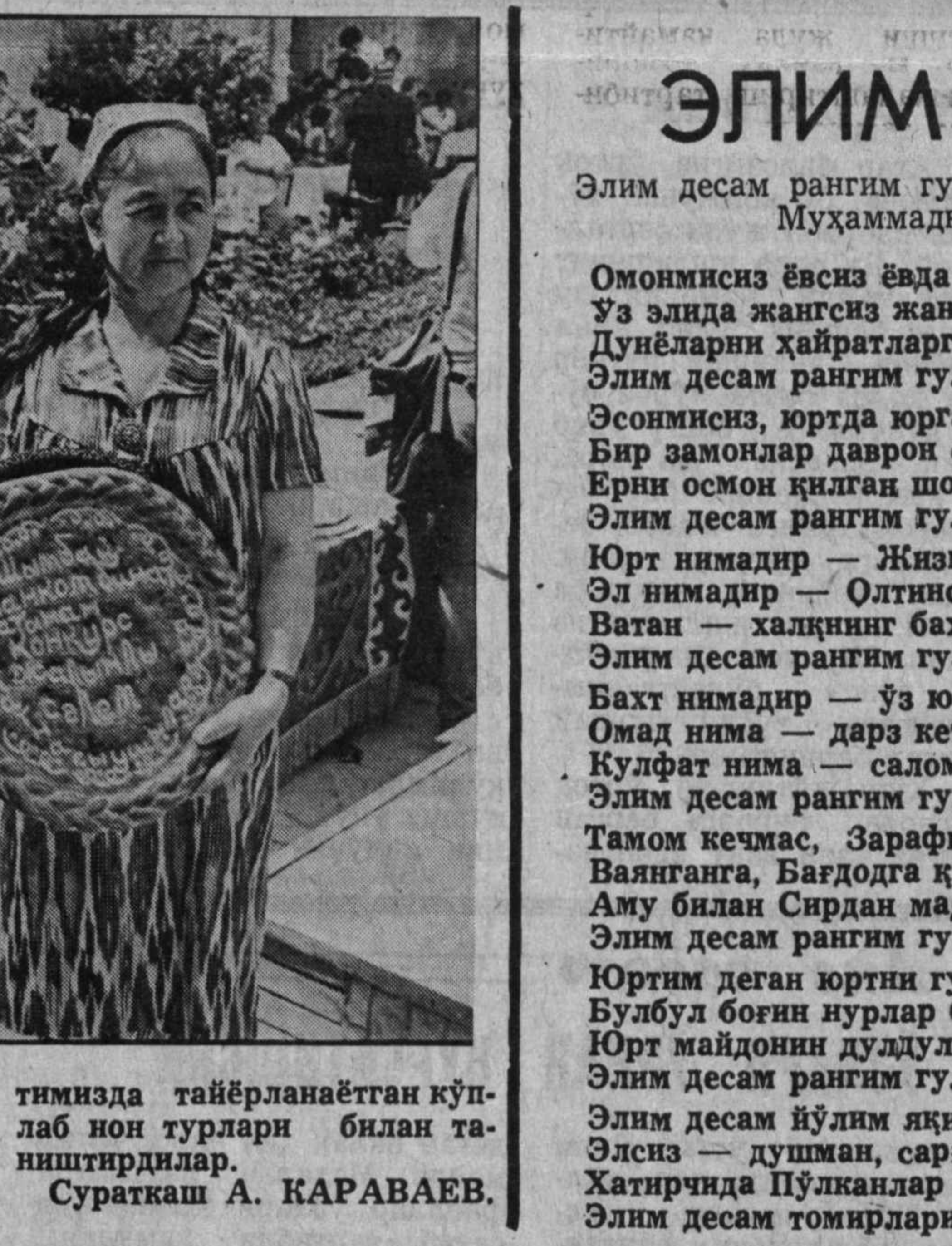
тинмида тайёрланаётган қўлда нон турлари билан таништирилди.