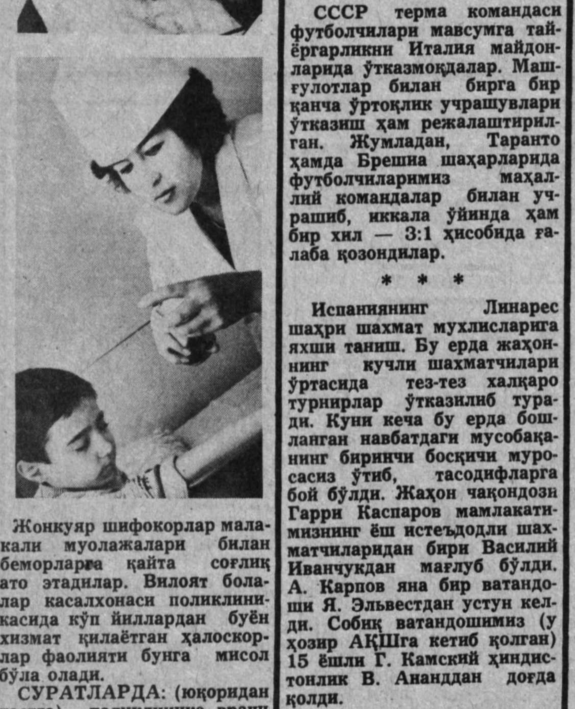
Жонқуяр шифокорлар мала-кали муолажалари билан беморларга қайта соғлиқ ато этдилар. Вилоят бола-лик касалхонаси поликлини-касида кўп йиллардан буён хизмат қилаётган ҳалоскор-лар фаолияти бунга мисол бўла олади.

Уларни бунга нима маж-бур этди, деб сўрасиз ба-лки. Шаҳардаги ОБХСС хо-димлари, ишч наозорчи гу-руҳлари текишурувлари юза-ки ўтказанликлари, таъми-нода ўзгариш сезилмагани-ги учун ўсимрлар уларга ишонч қилишганига ўзла-ри киришинган экан. «Сало-матлик» норасийи ташки-лот аъзолари дўконларинг орда эшикларидан сумкалар-ини ўлдириб чиқаятган «кўнгилян» текишурувчи-ларни кўла тушириб, варақал-орқали уларнинг қилгилни бунга шаҳарга маълум қил-дилар, суратларини девор-ларга ёпиштириб чиқдилар. Еш қасоскорларни тежда ша-ҳар аҳолиси севиб қол-ди, одамлар дард-ҳасратларини уларга айтган экан. «Саломатлик» аъзолари тежда савдо базаридан ўз-ларига содиқ шериклар ҳам топилди. Улар бериб турган махфий ахборотлар «ша-калли молларни пулдор-ларга ўтказишга устаси фаранг бўлиб кетган қўр-ларнинг фой этишда кўла бошлади. Бир пайтлар Нью-Йорк шаҳрида ҳам шунга ўхшаш ҳурўр яширини ш олиб бор-ган эди. Гурўҳга аъзо бўл-ган 15-17 ёшли ўсимрлар