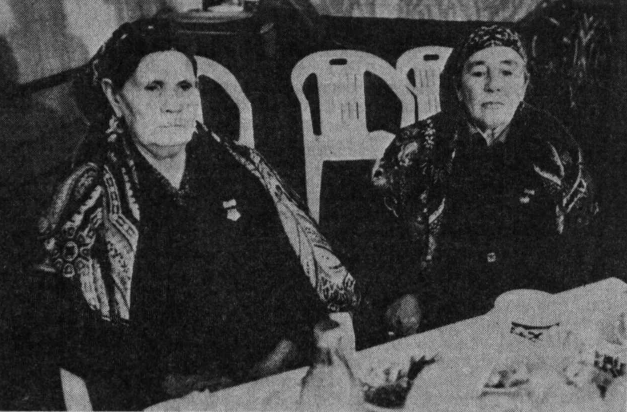
Суратларда: тантанадан лавҳалар.