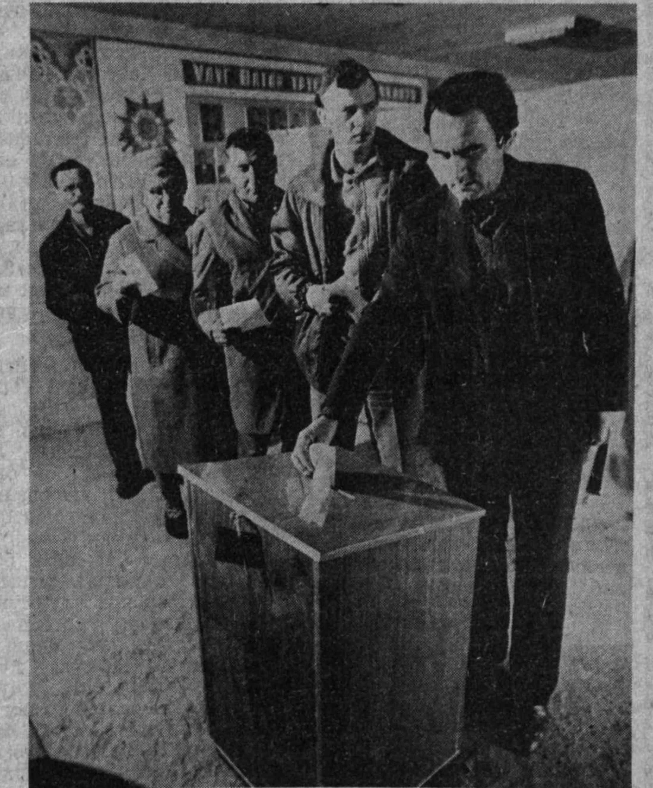
Шу кунги референдумда фаол иштирок этишди.

● КАЛИНИН районидан Қатороқ қишлоқ Совети ҳудудидан «Партия XX стезид» жамоа ҳужалигида жойлашган 15-участкада ҳам референдум уюштурулиши билан ўтказилди. Шу райондаги 13-марказий участкада 2278 киши овоз берди. Суратнамимиз А. Тўраев олиб қайтган ушбу таъсирлар ана шу участкаларда олинган. Навбадда овоз беришчилар (юқоридан ўнгга) ўз фикрларини билдиришда; Ташбековлар оиласи вакиллари ҳам шу кунги референдумда фаол иштирок этишди.