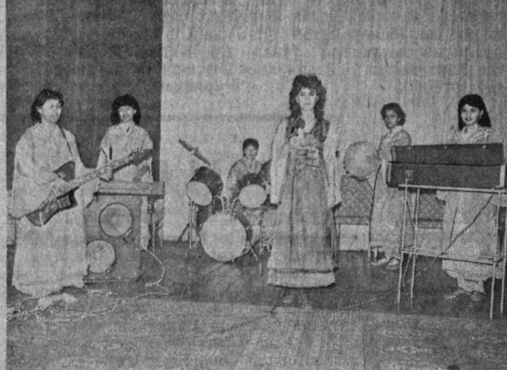
Суратларда: Навруз айёмига бағишланган кечга қизғин таралуд қўрилмоқда.