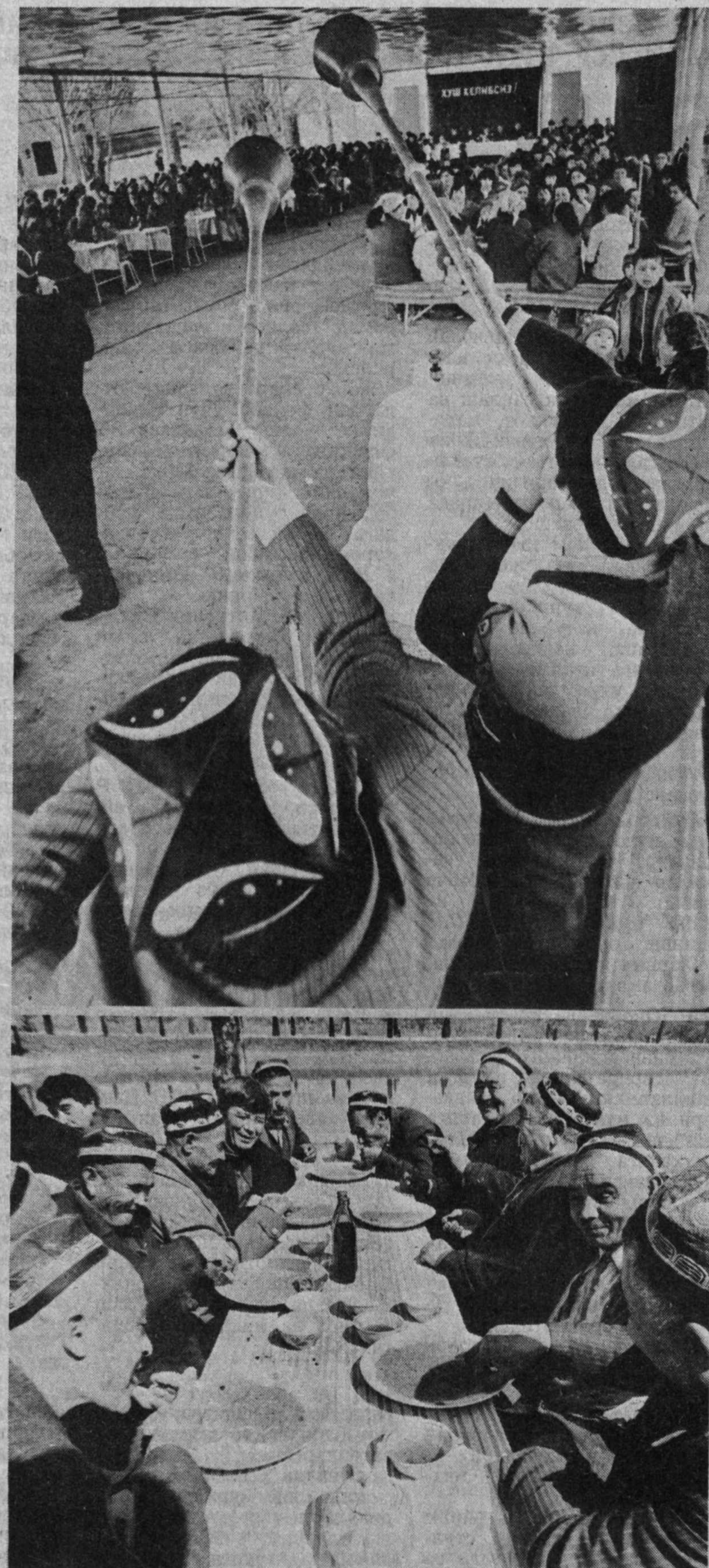
Тошкент райондаги «Ленин йўли» жамоа хўжалигида Наврӯз тантана лари.