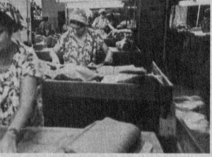
«Юлдуз» очиқ турдаги хиссадорлик жамиятида тиклаётган костюм-шиллар бугунги кунда хоржий мамлакатларда ишлаб чиқарилаётган маҳсулотлардан асло қолнимайди. Корхона ишчи ва хизматчилари ишлаб чиқаришда асосий эътиборни сифатга қаратишмоқда.