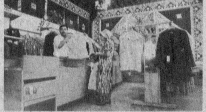
СУРАТЛАРДА: бirlашма цехининг кўриниши ва жамоанинг фирма дўқони.