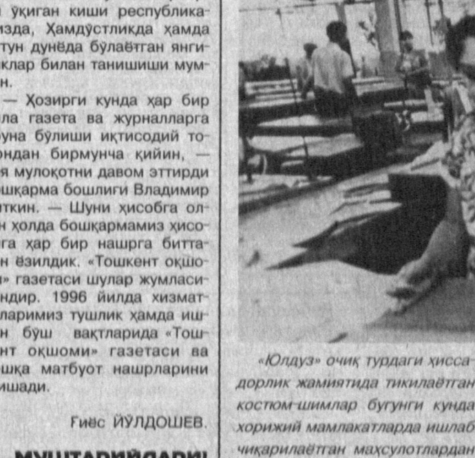
«Юлдуз» очиқ турдаги хиссадорлик жамиятида тиклаётган костюм-шиллар бугунги кунда хоржий мамлакатларда ишлаб чиқарилаётган маҳсулотлардан асло қолнимайди. Корхона ишчи ва хизматчилари ишлаб чиқаришда асосий эътиборни сифатга қаратишмоқда.

Шу кунларда ўзингиз севган «Тошкент оқшоми» газетасига 1996 йил учун обуна давом этмоқда. Бутун йил бўли газетада босилган мақолаларни мунтазам ўқиб бораёй десангиз вақтни бой бермай газетга обуна бўлинг. Шаҳримиздаги барча алоқа бўлимларида «Тошкент оқшоми»га бир ойга, уч ойга, ярим йилга ва бир йилга обуна қабул қилинмоқда. Қанча мурдатта обунани расмилаштириш уз ихтиёрингизда. «Тошкент оқшоми»нинг индекси — 64690.