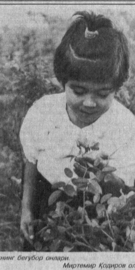
Болаликнинг бегубор онлари.

Рольф Хабинг ва Том Миллерлар тадқиқот давомида ана шундай ажойиб булутга «дуу келганлар» «Коинот алкоголь фабрикаси» ҳақиқий астрономик микдорда «ишлаб чиқариш қувватига эга: у Ер куралидаги ҳар бир одамни триллион илгав давомида, кунга триллион куража пивво билан «синайиши» мумкин экан!