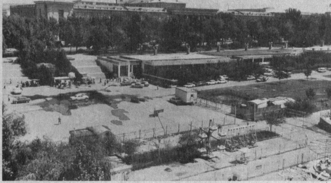
Пойтахтимизнинг Навоий кўчасидидаги савдо дўконлари расгаларида ҳар кунги ҳаёт қайнайди.