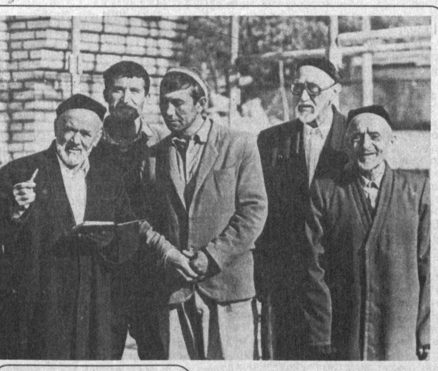
Эски шаҳар ёшаради