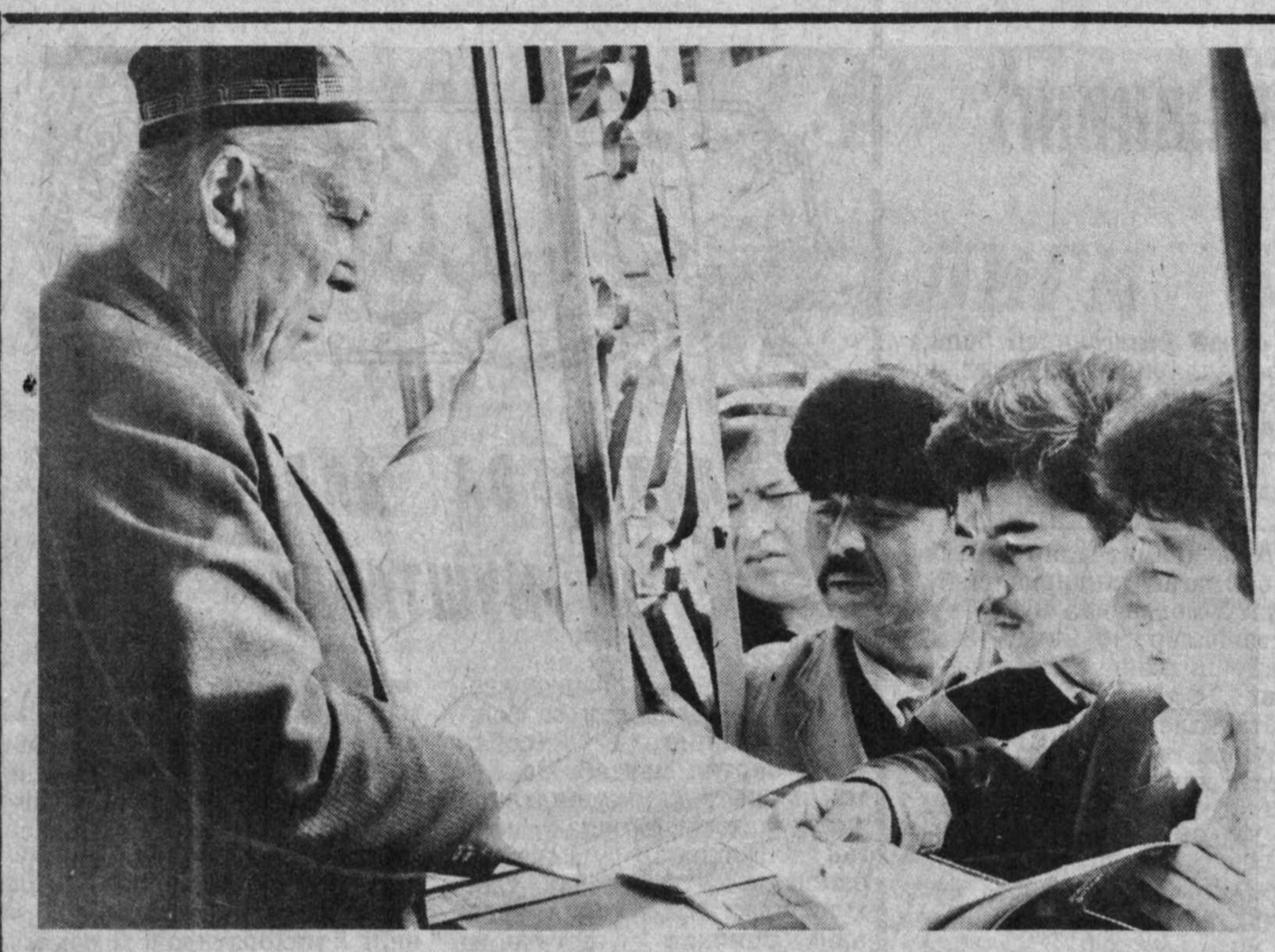
Ўқувчилар китобхонада китобларни кўриб чиқариш