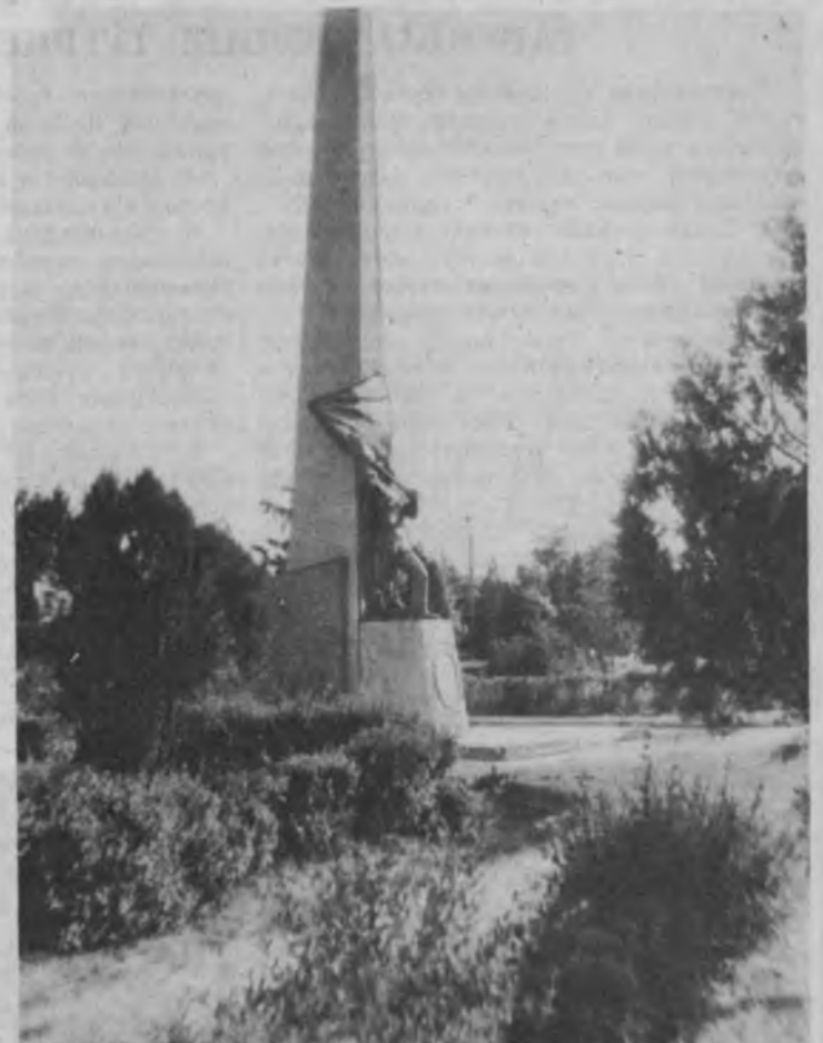
ҲЕЧ КИМ, ҲЕЧ НАРСА УНУТИЛМАЙДИ! Суратларда: Тошкент туманидаги Охунбобоев номи жамоа ҳужалиги, Олмалик шаҳри, Ангреш шаҳри меҳнаткашларнинг зиёратгоҳлари.