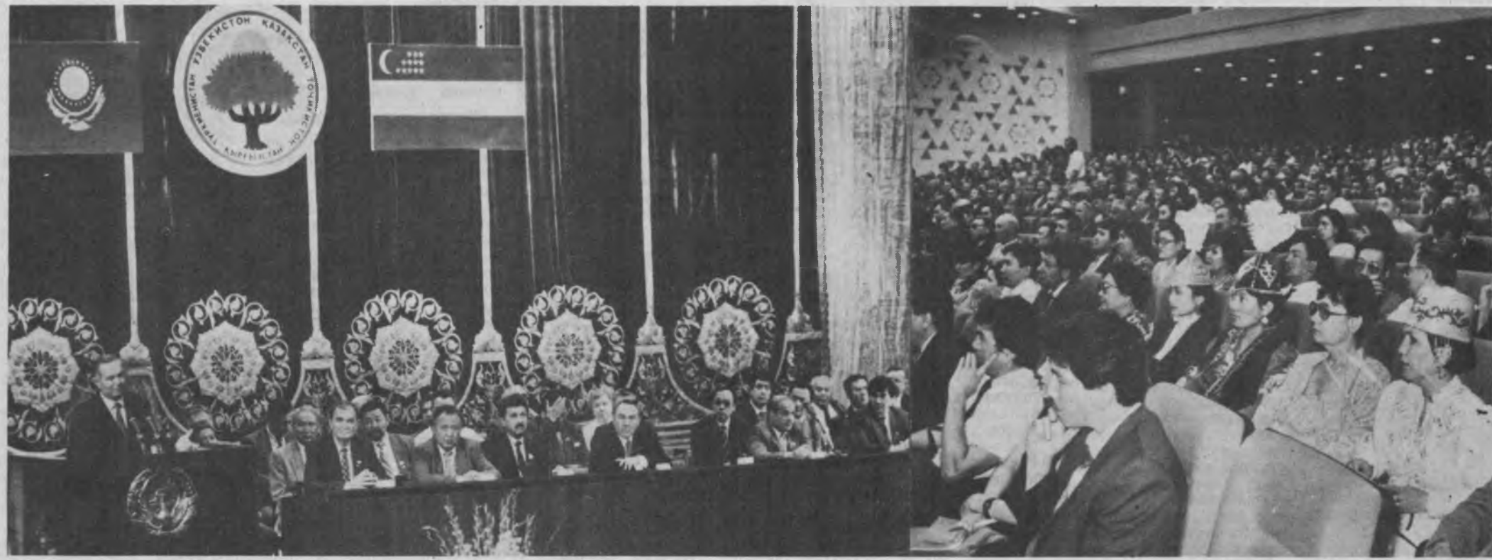
СУРАТДА: Ўзбекистонда Қозоғистон кунларининг тантанали очилиш маросимидан лавҳалар.