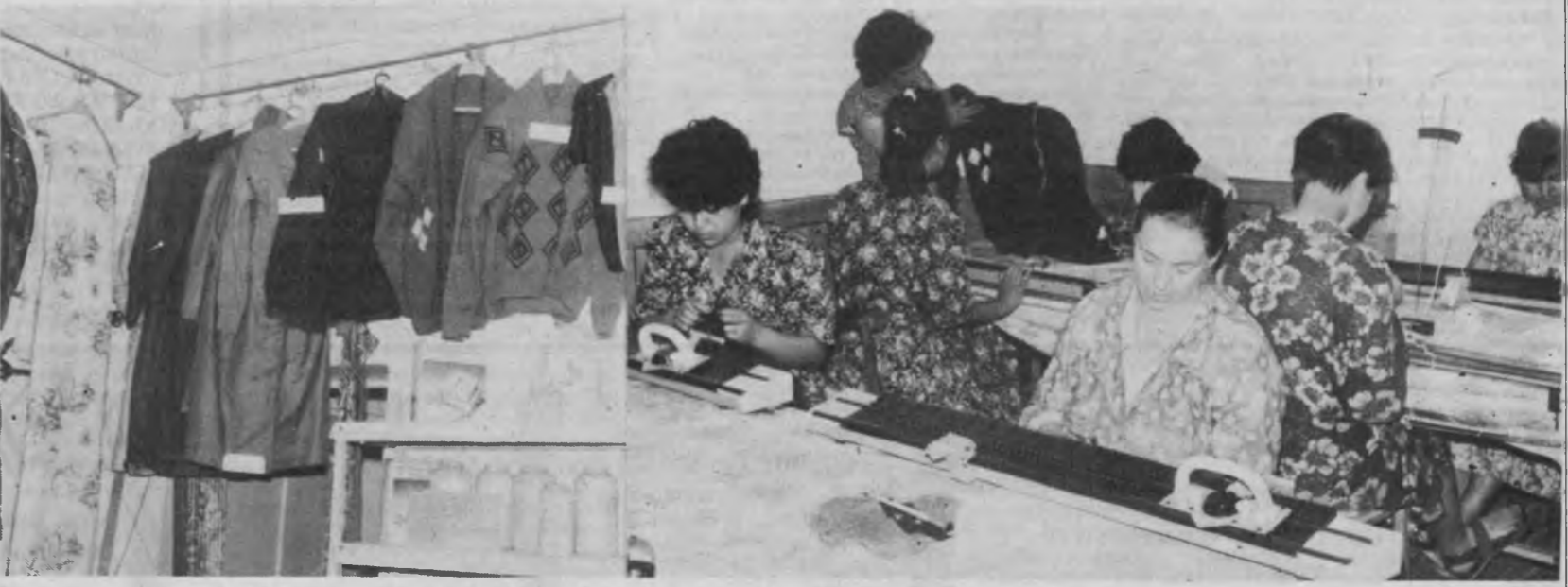
• БЎСТОНЛИҚ тумани меҳнат биржаси орқали қўпгина ешлар ишга жойлашди. Бу ерда туман ҳокимлиги биржага кичик корхоналар очибди ақиндан ердан бермоқда. Суратда: тумандаги кичик корхоналардан бирида иш жараёни.