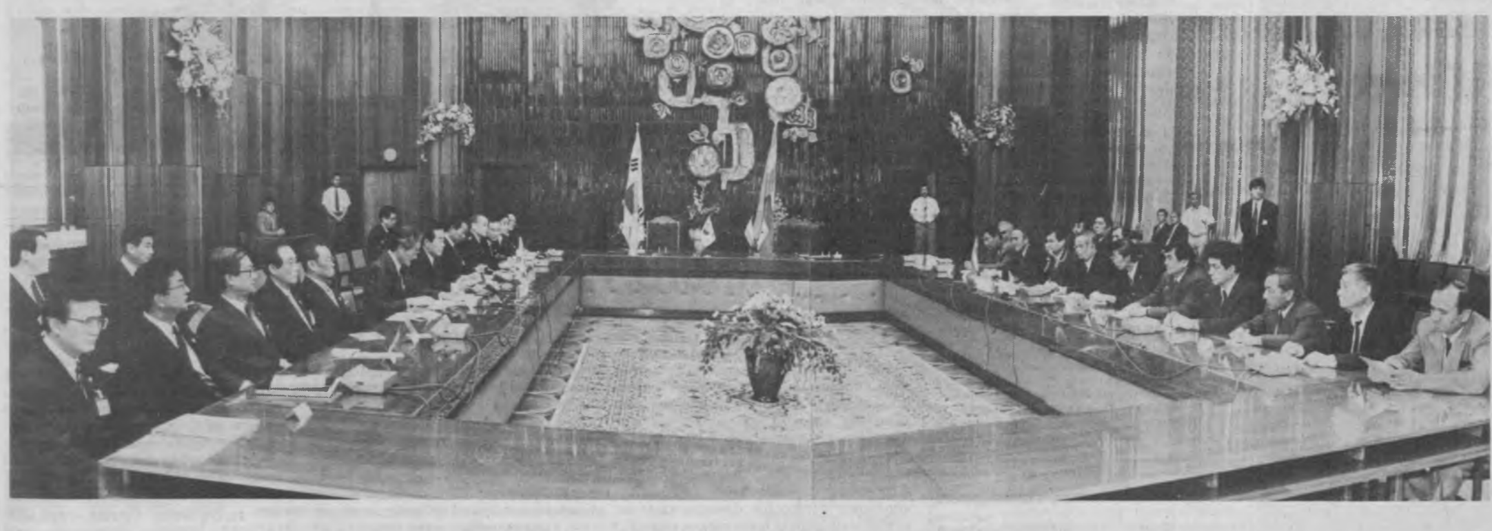
Халқлар Дўстлиги саройининг машғул залдаги музокаралар пайти.