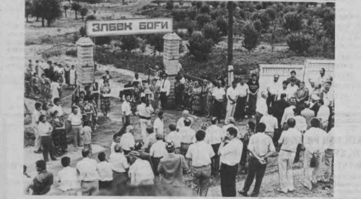
Кўй мени, майли, мен шоир бўлайин, Ултичмак шеър, шеър деб ўлайин...