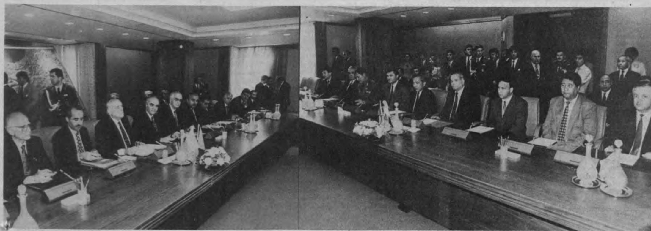
Ички мамлакат делегациялари учрашуви.

Юрий Федорович Пайгитов Ўзбекистон Республикаси Бош вазирининг ўринбосари этиб тайинлансин. Ўзбекистон Республикаси Президентини И. КАРИМОВ. Тошкент шаҳри, 1994 йил 27 июнь.