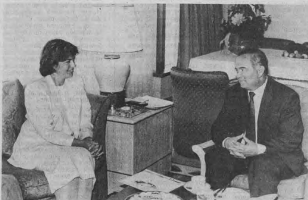
Ислам Каримов ва Туркия Бош вазирини Тансу Чиллер.

«Бу гапга сафардан асосий мақсад Ўзбекистон ва Туркия ҳамкорлигини янги bosqichga kuterishdir».