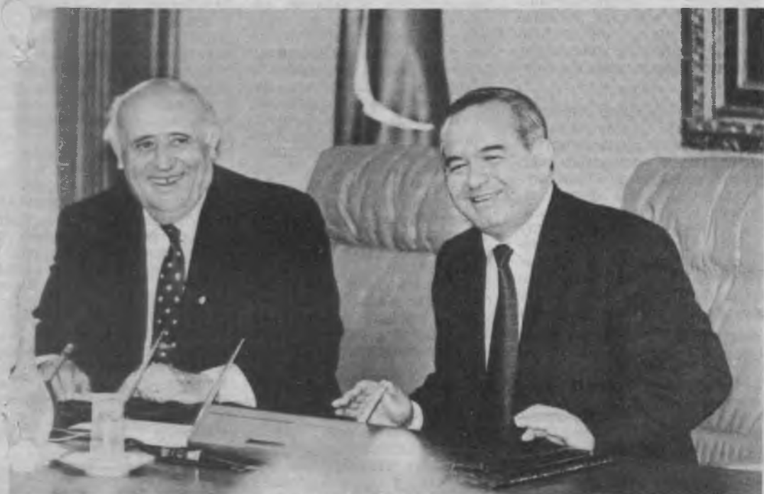
СУРАТЛАРДА: Мамлакатимиз Президентини Ислам Каримов ва Туркия Республикасининг Президентини Сулаймон Демирел.