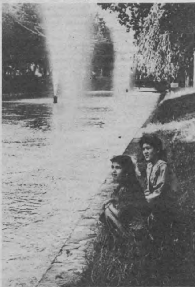
«Анхор бўйи қанчалик ҳузурбахш.»

Тошкент тумани, Ғ. Абдуллаев номи жамоа ҳўжалиги.