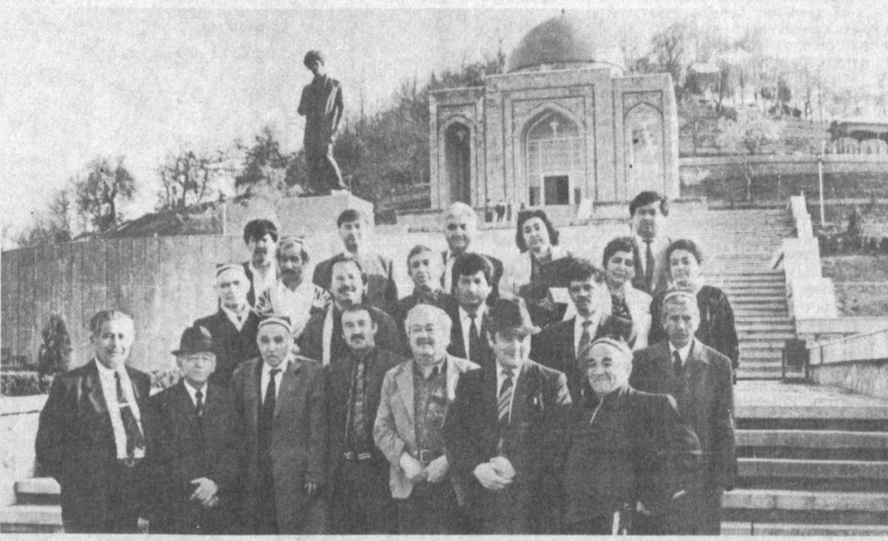
Амир Темур таваллудининг 660 йиллиги олдидан

Халқ хотира-сига муҳрланган қайдиларда айтилишича, Амир Темур Ҳўжанддаги машҳур масжиду жомеалар: Шайх Муслихиддин (1092)нинг макбарасини таъмирлаш учун ўн минг динор тилла ажратган бўлса, қадимий Қосоний шаҳридаги жомеа ҳам шунча маблағ ажратган. Бу-вайдалади Шохжойил, Биби Убайд мажмуалари, кўна Угадандаги машҳур тарихий минора ва макбаралари таъмирлашга ҳам бош-қош бўлган эканлар. Халқ