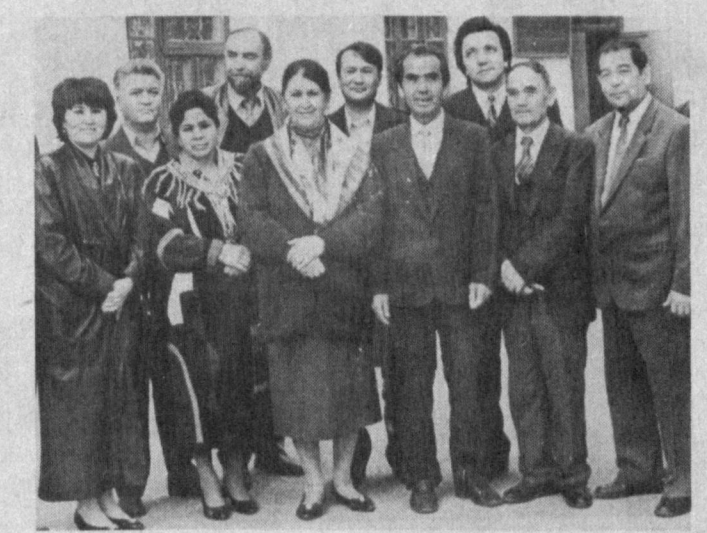
Швейцария, Исроил сингари хорижий давлатларда ҳам таълим олиб ўқиди. Энди Марказий Осиё ҳудудида келсак, шунини таъкидлаш