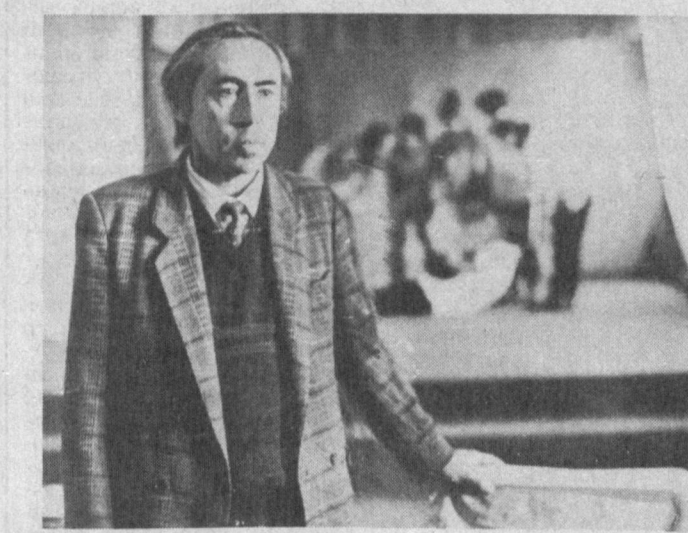
Ўз фаолиятининг кўламдорлиги билан собиқ иттифоқ доирасига кирган кўпгина республикаларга ҳам хизмат қилди. Чунончи, миллий курслар ора-