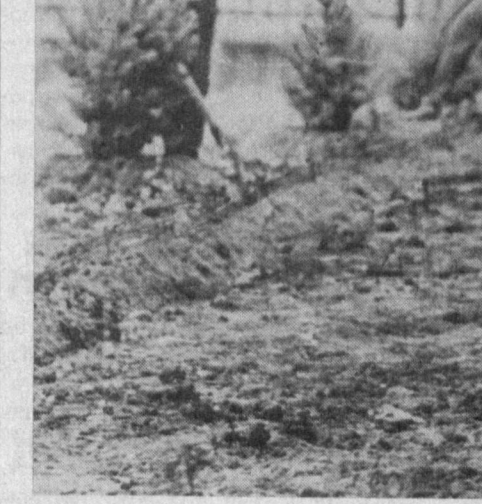
Шахримизда кўлаб ташкилотлар қатори «Ирригация» трестининг қурилиш-таъмирлаш бошқармалари ҳам ободлаштириш ва кўксаландириш бўлимида фарр иштарок этишмоқда.

Шахримизнинг кўм-кўк, ораста, гўзал бўлишига қатор ташкилотлар ўз улушларини қўшмоқда.