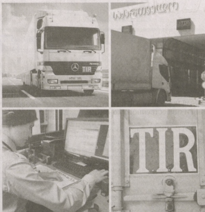
перемещение товаров через границы.

Состоялось обсуждение ряда важных вопросов по упрощению процедур торговли. Участники заседания приняли Приложение 11 к Конвенции МДП, обеспечивающее правовую основу для безбумажного применения книжек, что в конечном итоге обеспечит прозрачность при осуществлении международных транзитных перевозок, а также облегчит торговлю и безопасное