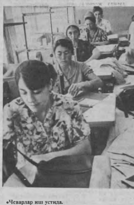
«Чеварлар иш устиди»