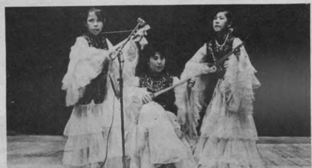
«Ий-ота» номидаги жамоа ҳўжалигида бўлиб ўтган тантаналардан лавҳалар.