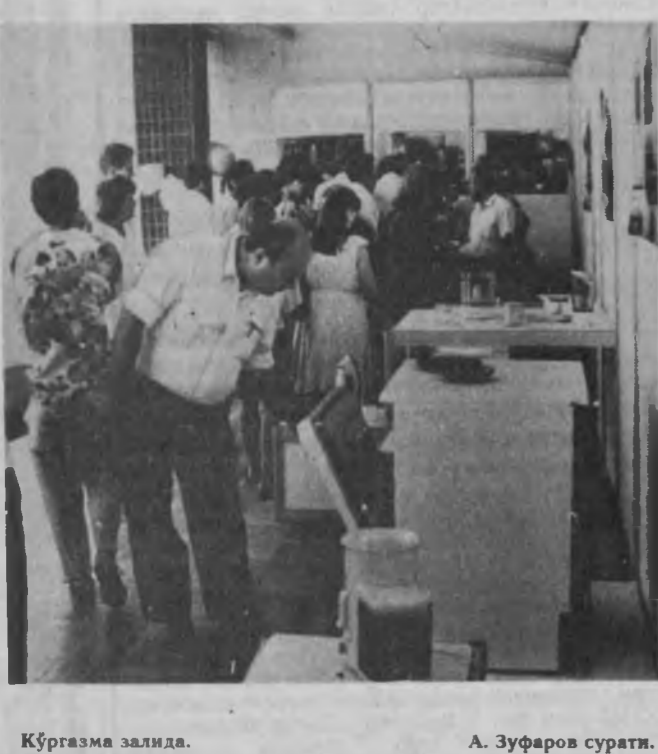
Кўргазма залида.

— Мазкур кўргазмани ташкил этишдан мақсад, — деди у, — Ўзбекистонда фирманинг электротўқаллик маҳсулотларига бўлган талабини ўрганиш. Сифатли ва экология нуктаи назаридан зарарсиз бўлган асбоблар Ўзбекистонда муваффақият қозонади, деб ишонамиз.