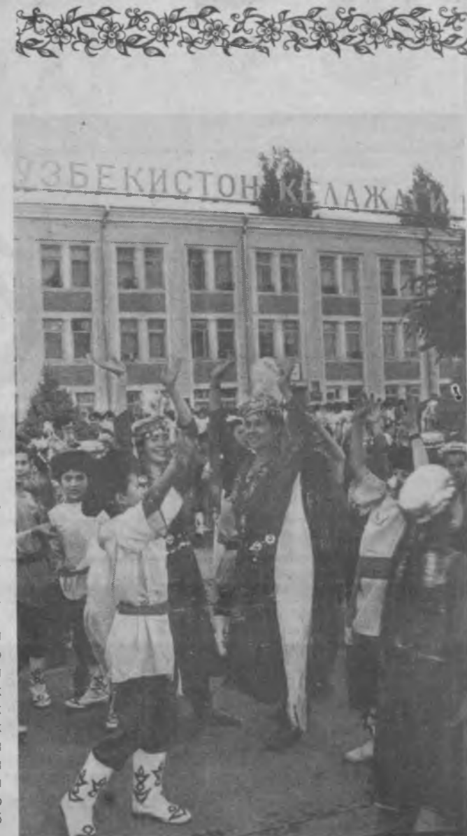
Тошкентнинг Мустақиллик майдонидан бўлган тантаналардан ўЗА мухбирлари А. Зуфаров ва Ф. Курбонбоев олган суратлар.