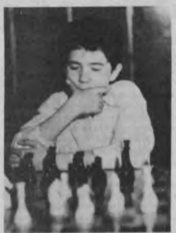
давлатимиз ҳаётидаги ана шу шонли воқеага бағишлайман. Т. ГОЛУБКИНА, ўза мухбир.

Рустам мусобақанинг якунловчи ҳисмида етти имкониятдан бешта хол тўплаб, барча ўйинчиларни орда қолдирди. Ўзбекистонлик еш спортчига эсдалик куботи ва олтин медаль топшириди.