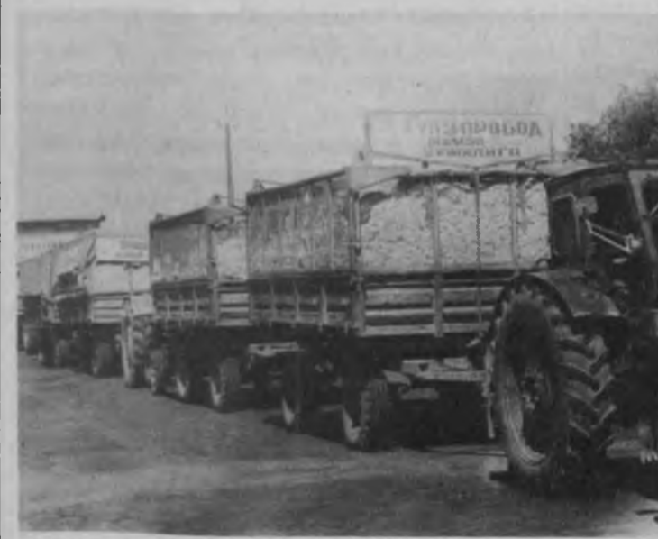
БУ йил Чиноз тумани меҳнаткашлари ҳам 6,5 минг гектар ерда яна пахта ҳосили етиштирдилар. Эндиги диққат-эътибор ана шу етиштирилган ҳосилни не-нобузд қилмай йиғиб-териб олишга қаратилган. Кунини кеча туман пахта тозалаш заводида биринчи пахта қарвонларини қабул қилиб олишга бағишланган

Кеча Оккўргон ва Куйичирчиқ туманларида ҳам биринчи ҳосил қарвонлари ташкил этилди. Қабул пунктларига дастлабки "оқ олтин" дурдоналари етказиб берилди.