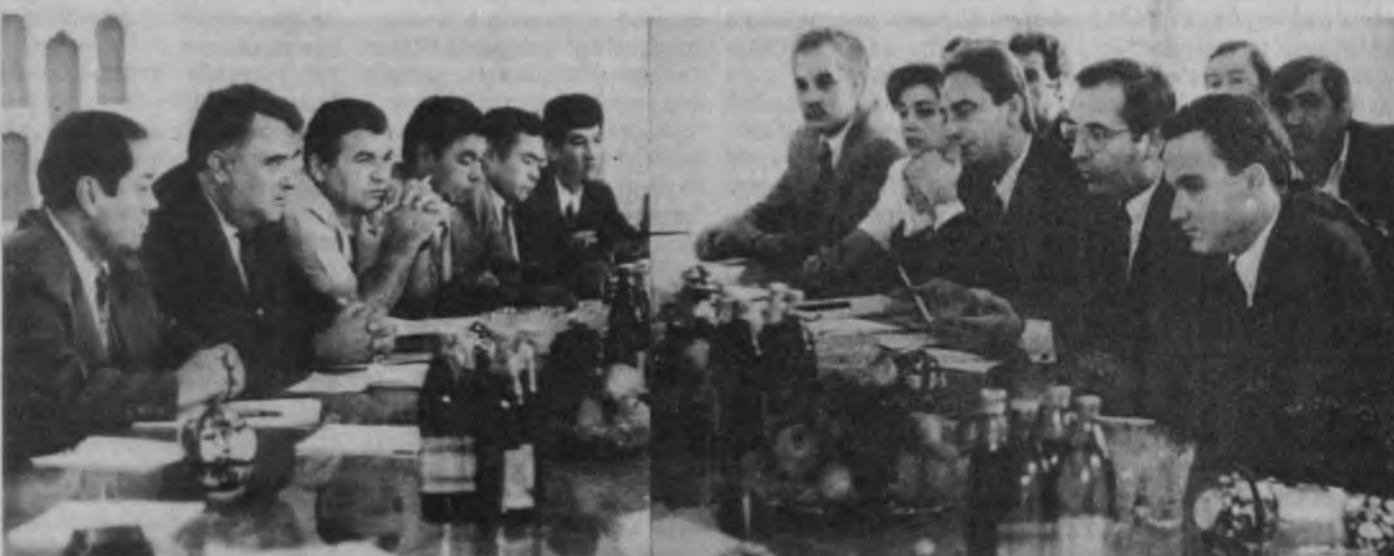
СУРАТДА: учрашу пайти.