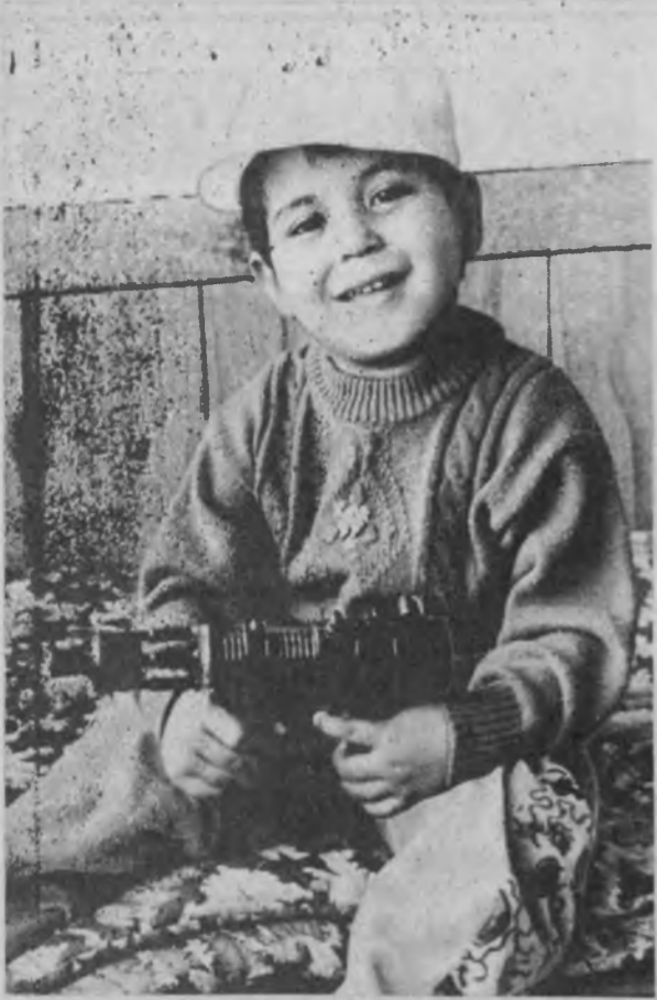
Катта бўлсам, юрт посбони бўламан. Д. АХМАД сурат-лавҳаси