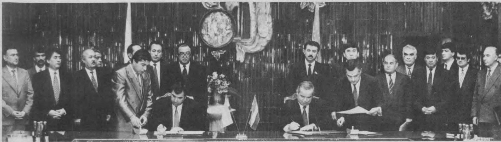
СУРАТДА: Декларацияни имзолаш пайти.

8 октябрь куни Тожикистон Республикаси Олий Кенгаши Раиси Имомали Раҳмонов раҳбарлигидаги шу мамлакат делегацияси расмий-амалий ташир билан Тошкентга келди.