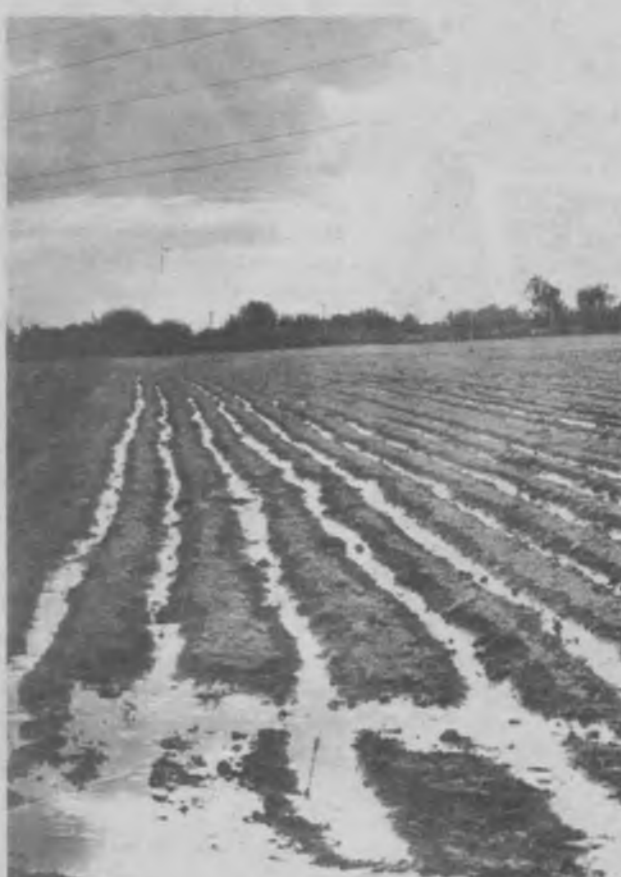
• Чиноз туманидаги Охунбоев номи жамоа ҳўжалигида барвақт галла экиб бўлинди. Айни кунларда галла майсаларини текис ривожланиши учун замин яратилмоқда, сув қўйилмоқда.