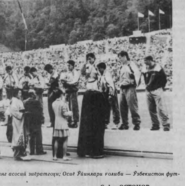
Суратларда: Хиросима шаҳрининг асосий зиёратгоҳи; Осиё ўйинлари ғолиби — Ўзбекистон футболчиларини тақдирлаш пайти.

болаларнинг шўх ўйинлари, денгиз, тоғ, атом бомбасидан ларзага келган, айронга айланган Хиросима қўёғаси — буларнинг барчаси саҳнада ўз аксини топди. Япония императори Акхито рафиқаси билан, шаҳзода Нарухито рафиқаси билан стадионга кириб келадилар. Бу кутилмаган воқеа эди. Ҳатто японларнинг ўзлари ҳам Императорнинг оиласи билан яқин орада бундай тантаналарда қатнашганини эслашолмади. Осиё ўйинларини ташкил этиш учун 22 миллион япон иени сарфланди. Унлаб янги спорт базалари қурилади. Барча шарт шартлари бўлгани, 7 миң спортчининг ўз ичига олган Олимпия шаҳарчаси қуриб этилди. Ўйинларни оммавий ахборот воситаларида фритиш учун 5 миңдан зиёд журналист рўйхатдан ўтди. Бир латининг ўзида 500 журналистнинг ишлари учун матбуот уйи фаолият қўрсатиб турди. Бу ерда қўйилган 20 та монитрдан мусобақалардан репортажлар олиб борилди. 10лаб компьютерлар қаламқашлар иштирокида қўллаб қаламқашларда спорт мусобақалари, спортчилар ҳақида тўлиқ маълумот олиш мумкин эди. Қисқаси, журналистлар ишлари учун ҳамма нарса муҳабб этилган эди.