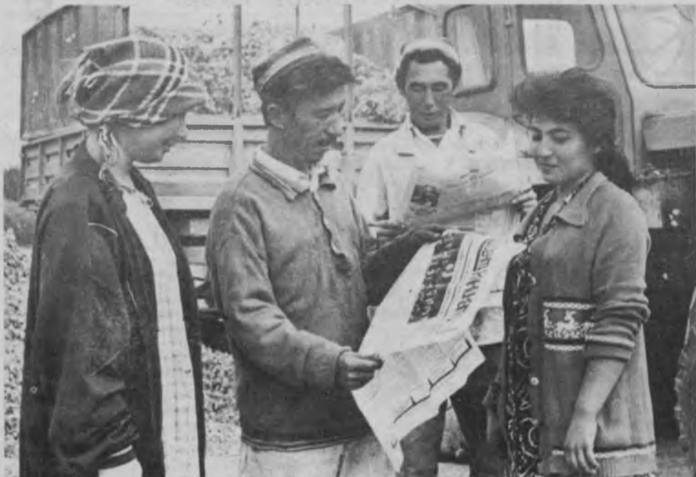
"Гулзоробод" жамоа ҳўжалиги (Чиноз тумани) пахтакорлари йиллик режани бажардилар. Уларни ўз касбдошларининг меҳнат ютуқлари ҳақидаги янгиликлар ҳам қизиқтиради.

ҚАДРДОН ГАЗЕТАНГИЗГА ОБУНА БЎЛИШГА ШОШИЛИНГ!