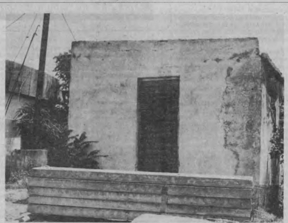
Паркент тумани марказидаги қурилиши тугалланмаган электр тақсимлаш пункти