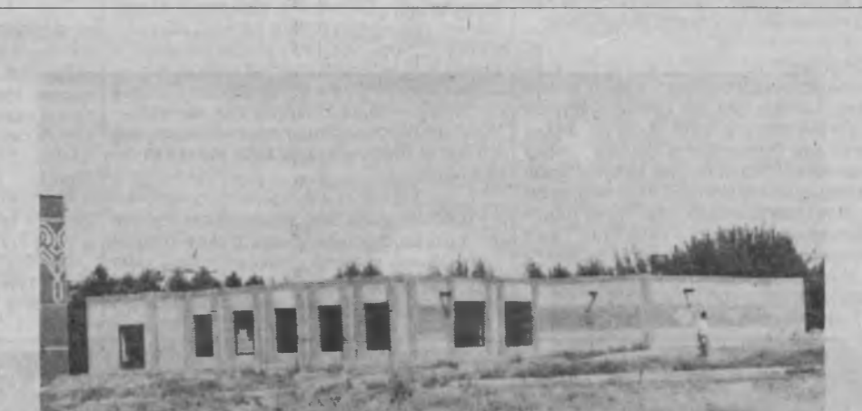
Чирчиқ шаҳрининг 10-даҳасидаги сабзавот дукони.