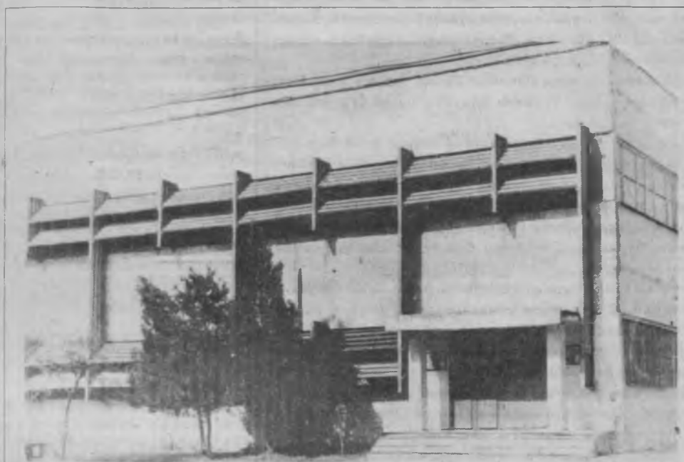
Ангрен шаҳрининг Навоий кучасидаги кимевий усулда тозалаш комбинати.

Вилоят миқёсида илк марта ўтадан ушбу кимонди савдоси қўйилган иншоотлар билан танишди.