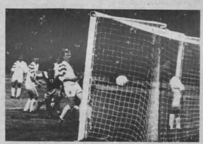
Салим ака, аввало муштарийлар, футболчилар ва эл йилларида мустақил Ўзбекистон...