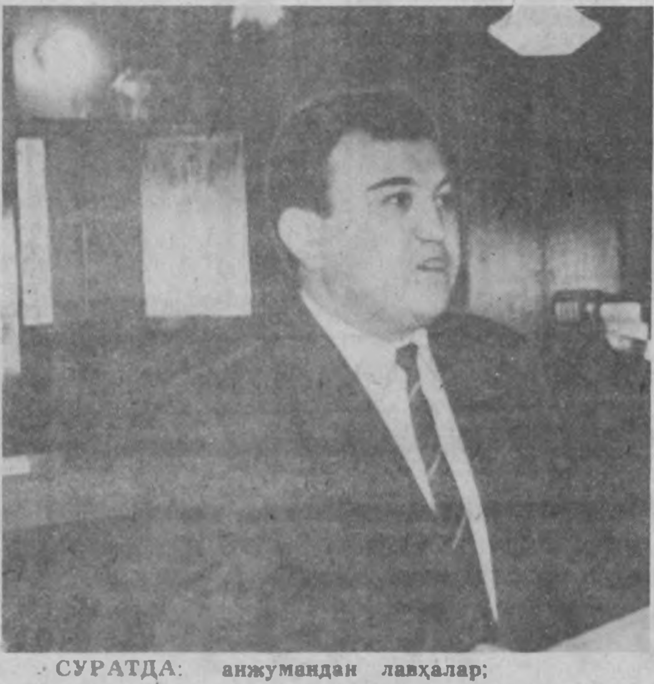
СУРАТДА: анжумандан лавҳалар;