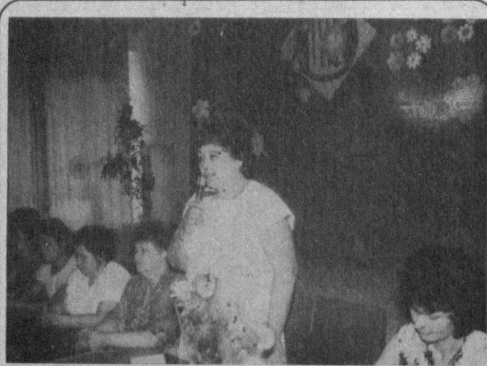
Келажагимиз — мактабда