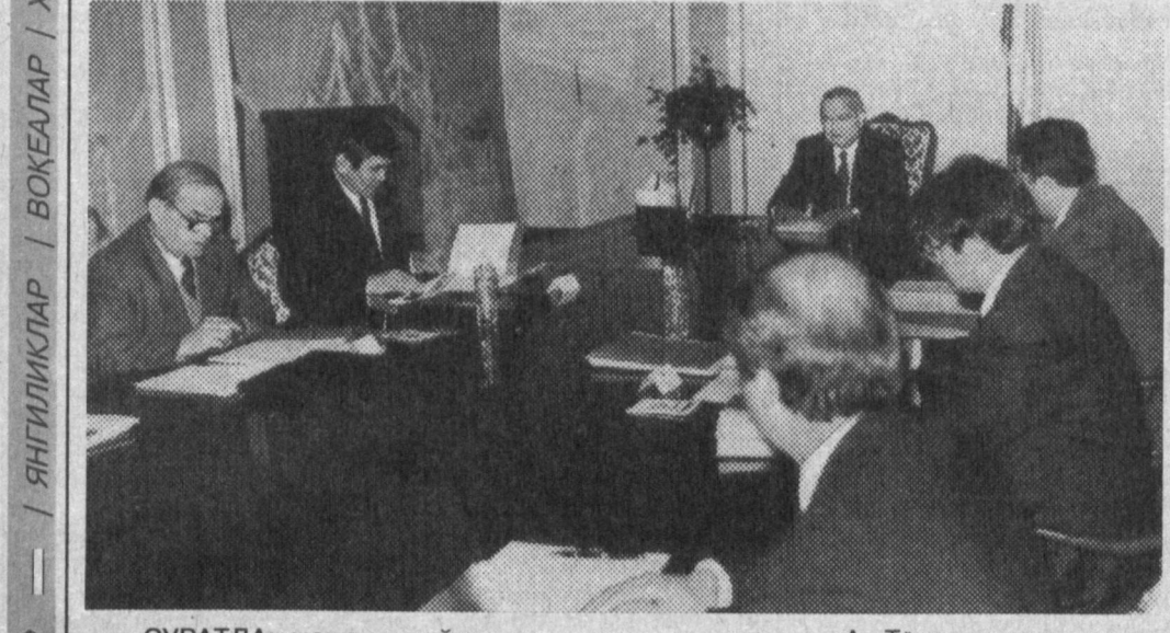
СУРАТДА: мажлис пайти.

12 декабрь кун Ислам Каримов Президентининг «Миллий хавфсизлик тўғрисида» ўзбекистон Республикаси қонуни лойиҳаси қуриб чиқилди, ушунга қўшилган ва по-рага сотилишига қарши курашни янада кучайтириш чоралари, шунингдек жамиятда ҳуқуқ-тартибот ва барқарорликни таъминлаш юзасидан давлатнинг ички ва ташқи сиёсати билан боғлиқ бошқа масалалар муҳокама қилинди. Республика Президенти Ислам Каримов мажлисда миллий хавфсизлик соҳасидаги стратегик йўналишларни белгилаб, айналий вазифаларга доир топшириқлар берди. Муҳокама қилинган масалалар юзасидан тегишли қарорлар қабул қилинди. (3/3)