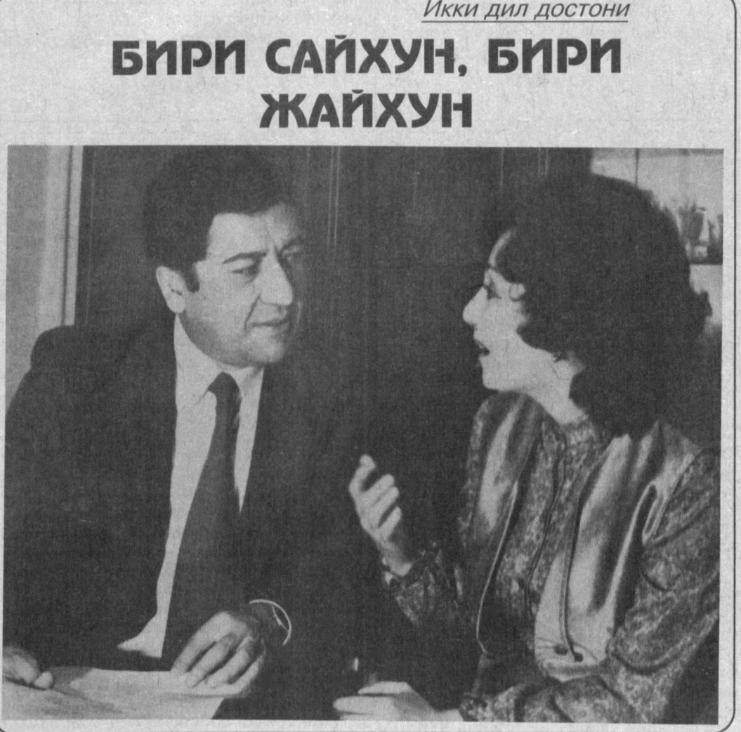
Икки дил достони БИРИ САЙХУН, БИРИ ЖАЙХУН

Узингизда синаб куриинг АЁПЛАРНИ АСРАНГ, ЭРКАКЛАР! 3 очко, «Йуқ» — 1.