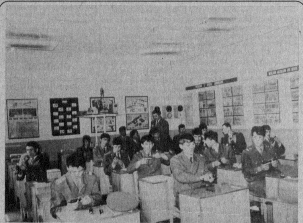
Тошкент шаҳар Ички ишлар бош бошқармасининг бошланғич милиция тайёров мактабида тинловчиларнинг ўз соҳалари бўйича ҳар томонлама билим-қўникмаларга эга бўлишлари учун барча шарт-шароитлар муҳайи этилган. Уқув дараҳида кўргазмалар қўраллардан ҳам хелг фойдалани- лаётгани малакалар тартиб посбонларининг етишيب қишқиларида муҳим омили бўлмоқда. СУРАТДА: тинловчилар машаурат пайтида.

● 4 декабрь кунни соат 20 дан 30 дақиқа ўтганда Миробод ту- манидаги «Миробод» базорида Ёллик шахридан келган Х.Усан жисмоний куч ишлатиш йўли билан Урта Чирчиқ туманидан ки- шилар ҳужалик маҳсулотларини сот- ганга келган А.Гулноранинг 2 ми- лд 200 сум пулини тортиб оли- гади. Талонни қўздан қўйиб бўли- шга улгурди. Бироқ шу туман ич- ки ишлар бошқармаси ходимла- рининг тезкор ҳаракатлари на- тижасида у тез орада қўлга олин- ди. Ушга шаҳардан келиб талон- чилик билан шуғулланган бу «мехмонга нисбатан жиноий жа- зо берилиши аниқ.