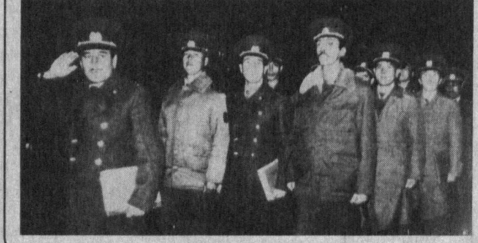
Тошкент шаҳар Ички ишлар бош бошқармаси ходимларининг тақсимот пайти.