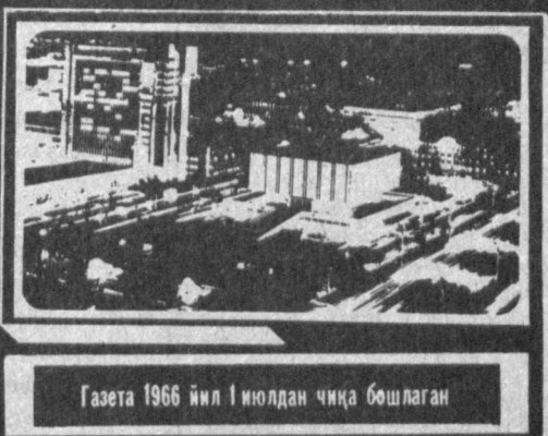
Газета 1966 йил 1 июлдан чиқа бошлаган

ЎЗБЕКИСТОН RESPUBLIKASI ПРЕЗИДЕНТИНИНГ ФАРМОНИ УЛУФ ВАТАН УРУШИ ЙИЛЛАРИДА ҲАРБИЙ МАЖБУРИЯТЛАРИНИ БАЖАРГАН ЎҚИШЛАРГА ПЕНСИЯЛАРИНИ ТЎЛАШ ТАРТИБИ ТЎҒРИСИДА 1. «Ишловчи пенсионерларга пенсияларни тўлаш тўғрисида» 1995 йил 20 ноябрдаги 1289-сон фармонга қўшимча равишда шу нарсга белгилаб қўйилсинки, улуф ватан уруши йилларида ҳарбий мажбуриятларини бажарган ёки мамлакат ички қарорлари билан ҳозирда ҳам ишлаб турган пенсионерларга 1996 йил 1 январдан бошлаб Ўзбекистон Республикаси ҳудудида пенсиялар тўлиқ миқдорда тўланади. 2. Ўзбекистон Республикасининг Ижтимоий таъминот, Муҳофаза, Ички ишлар, Молия вазирликлари, Миллий ҳавфсизлик хизмати ва Ижтимоий сўғурта фонди «Ишловчи пенсионерларга пенсиялар тўлаш тартиби»га бир ҳафта мuddат ичида тегишли қўшимчаларни киритсинлар ҳамда республиканинг барча вазирликларига, идораларига, корхоналарига ва ташкилотларига етказсинлар. 3. Ўзбекистон Республикасининг Адлия вазирлиги Молия вазирлиги билан биргаликда амалдаги қонунларни ушбу фармон қоидаларига мувофиқ ҳал қилиш борасидаги тақлифларни бир ҳафта мuddат ичида Вазирлар Маҳкамасига тақдим этсин. 4. Маъзур фармоннинг бажарилишини назорат қилиш Ўзбекистон Республикаси Вазирлар Маҳкамасининг зиммасига юклансин. Ўзбекистон Республикаси Президенти И. КАРИМОВ. Тошкент шаҳри, 1995 йил 28 декабрь.